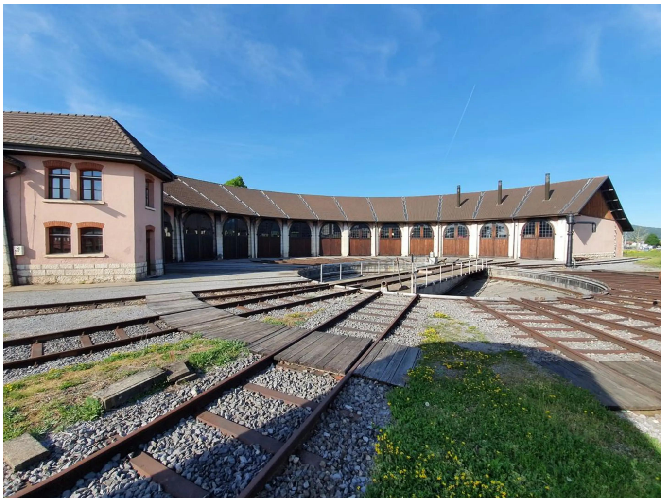
Ротонда Делемона

Откроет перед вами двери и ротонда Делемона в кантоне Юра, построенная в 1889 году. Здесь вы сможете со всех сторон обследовать вагон В 3505, который в настоящее время находится на реставрации, а также ознакомиться с великолепной исторической коллекцией Швейцарских железных дорог – даже взрослым захочется поиграть в паровозики!