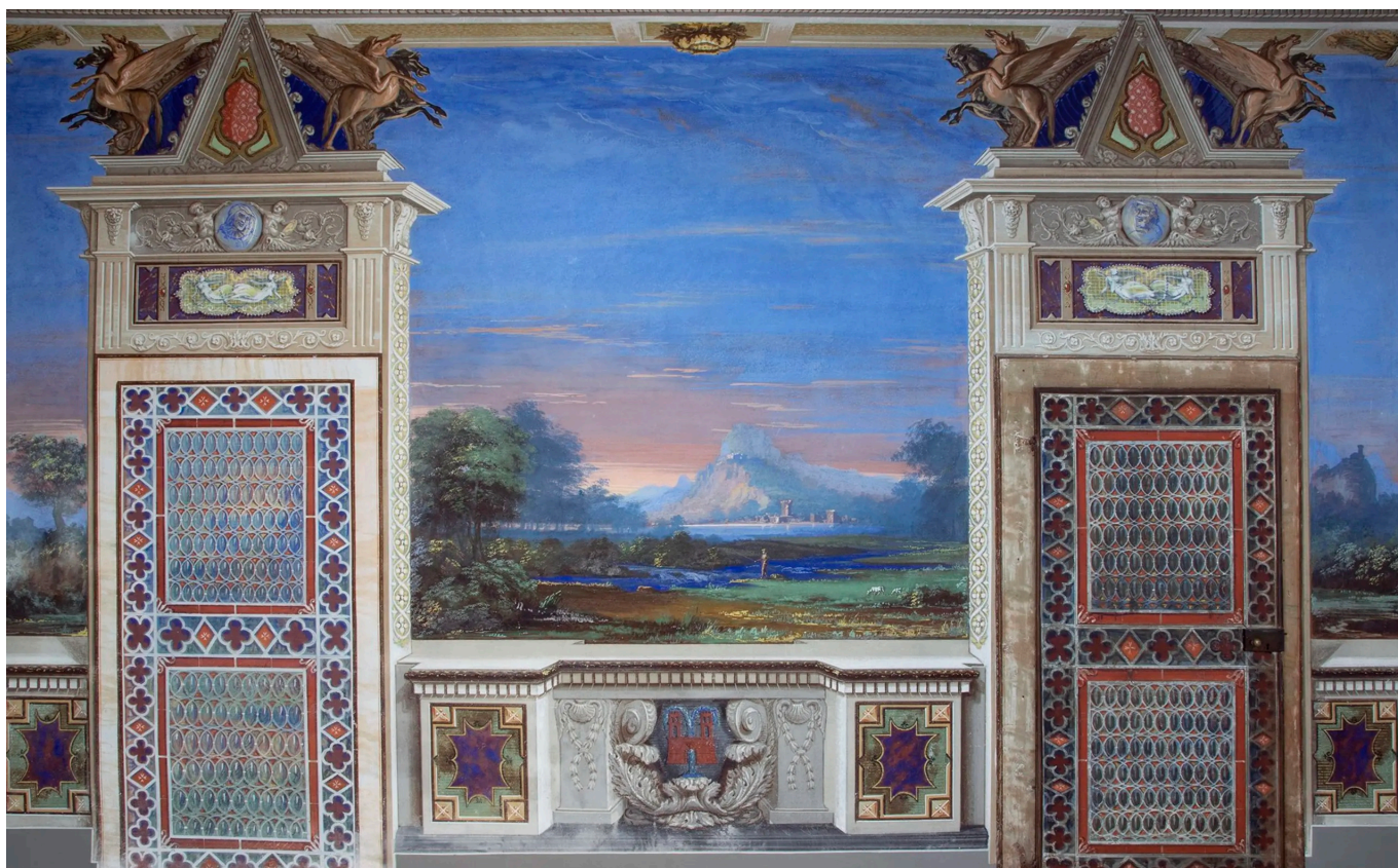
Ронко-сопра-Анкона