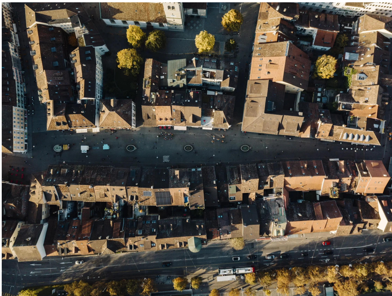
Старый город Винтертура

В плотно застроенном и оживленном Старом городе Винтертура, объекте национального значения, люди и исторические здания тесно взаимосвязаны. Многовековые несущие конструкции, исторические и современные жилые и коммерческие помещения, история домов и их обитателей... Работа по сохранению наследия в Старом городе объединяет широкий спектр дисциплин, обычно выходящих за рамки восстановления отдельного здания: от теоретического анализа и практического исследования до технического воплощения. Без сотрудничества многочисленных специалистов сохранение памятников было бы невозможным. Во время экскурсии по историческим переулкам вы узнаете больше о захватывающих связях между застроенным пространством и его интенсивным использованием в прошлом, настоящем и, вероятно, будущем.