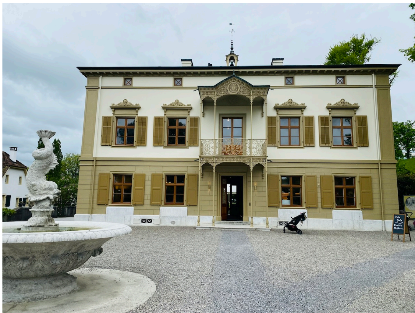
Вилла Мериан.

Сады Мериан расположены на природных «террасах», созданных рекой Бирс – левым притоком Рейна. Дикий тысячелетний речной ландшафт был преобразован в XIX веке. В 1824 году молодой агроном Кристоф Мериан, только что женившийся на Маргарете Буркхардт, получил эту местность в качестве свадебного подарка. Он основал здесь образцовую ферму, тщательно ухаживал за садом и парком и заложил основу для сегодняшних коллекций: со временем сельскохозяйственное угодье превратилось в уникальный садовый комплекс.