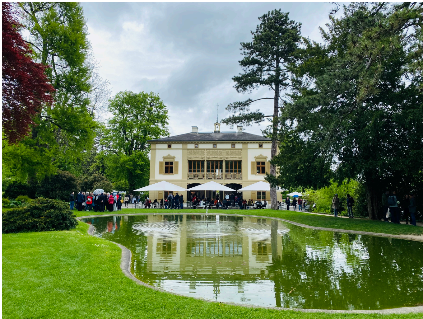
Английский сад.

Окружающая виллу местность разделена на несколько частей, для быстрого осмотра которых понадобится минимум полдня: разбитый в начале XIX века английский парк со старыми деревьями и прудом с лилиями, долина рододендронов и азалий, сухой биотоп, сад пионов, коллекция клематисов, огороды с редкими сортами фруктов, овощей и ягод, любовно оформленные клумбы многолетников, необычные луковичные растения всех форм и цветов, душистый шалфей, субтропические растения в горшках... В садах Мериан произрастает около 7000 различных видов и сортов растений и представлен самый большой в Швейцарии перечень ProSpecieRara (некоммерческая организация по сохранению культурно-исторического и генетического разнообразия растений и животных). На территории фермы и сада живут овцы, куры и кролики редких пород, а также медоносные пчелы. Уникальное культурное наследие садов сохраняется в соответствии с этическими принципами ICOM (Международного совета музеев) и стандартами головной организации ботанических садов BGCI.