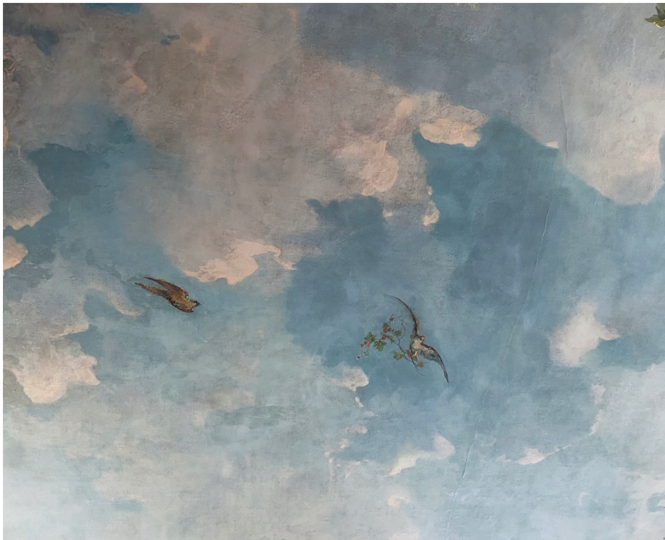
Росписи на первом этаже виллы.