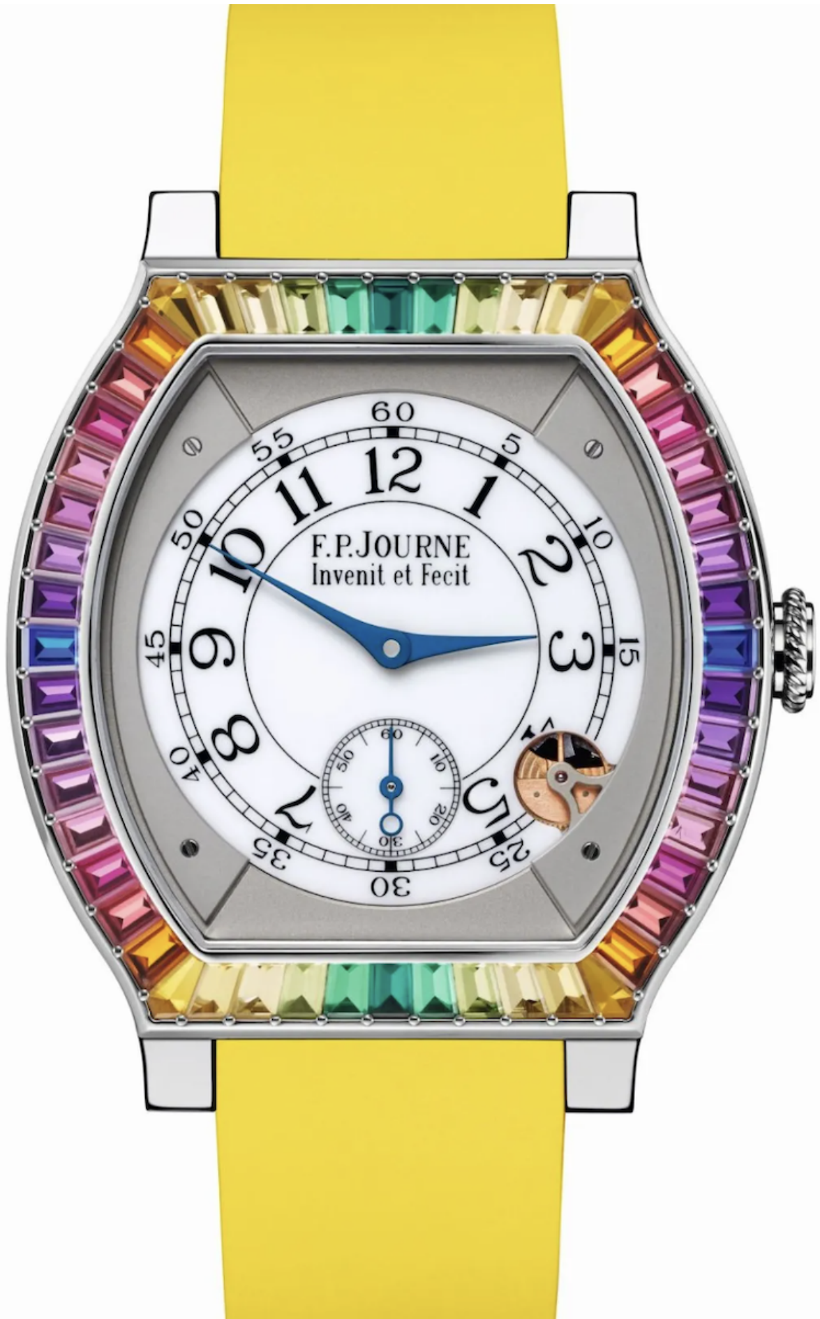
Модель élégante Gino's Dream

Приятных вам часовых открытий, дорогие читатели!