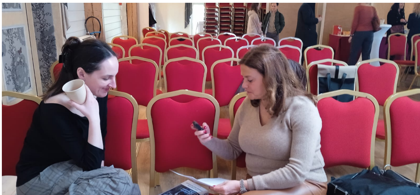
Во время интервью

Я не считаю, что это низший слой общества. Я вообще не считаю, что иерархичность в обществе полезна, и стараюсь максимально от нее отойти и в книге, и в жизни. К сожалению, наше общество крайне иерархично – об этом можно судить и по тому, каких героев мы чаще всего слышим в медиа. Мне всегда хотелось разговаривать именно с теми, с кем никто разговаривать не хочет, поскольку именно они могут рассказать, как все устроено, именно исключенные из системы знают о ней правду.