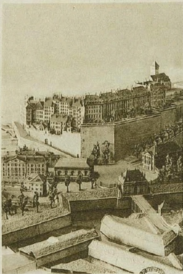
Une de la « Place de Neuve » en 1850.

На гравюре Огюста Магнена изображена place de Neuve в 1850 году