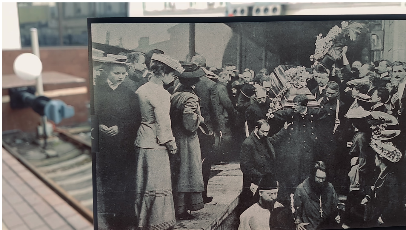
Прибытие гроба с телом А. П. Чехова на Николаевский вокзал