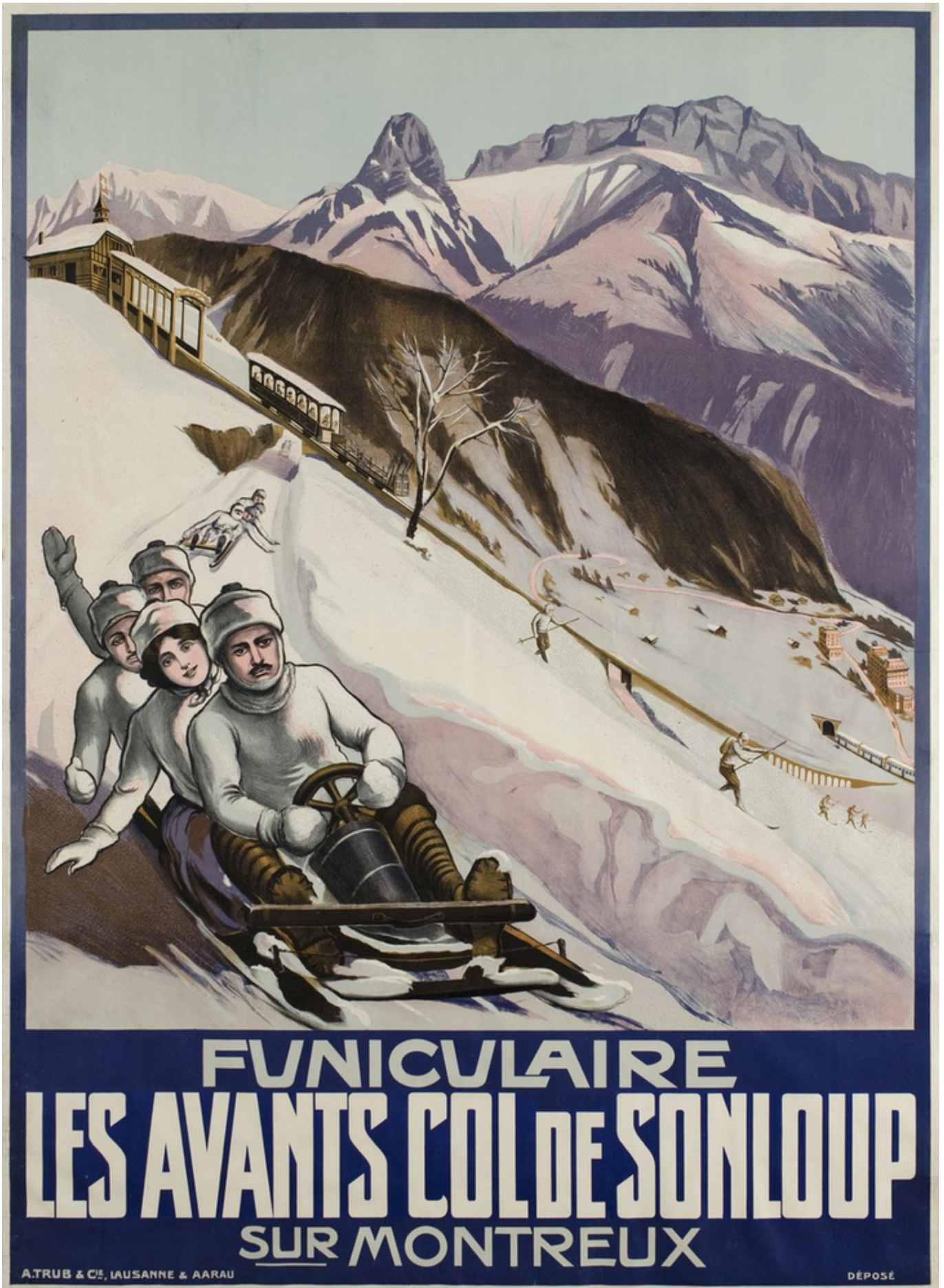
Одна из первых афиш, рекламирующих занятия зимними видами спорта, подготовленная в связи с открытием фуникулера Лез Аван - Сонлу в 1910 году.