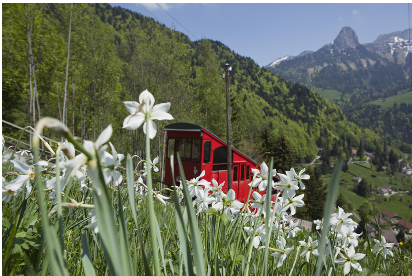
Фуникулер Лез Аван – Сонлу

Автор: Наталья Беглова, Монтре , 20.05.2022.