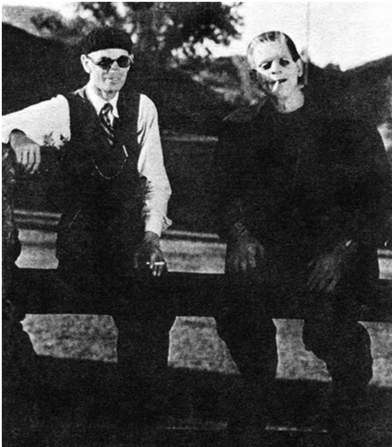
Джеймс Уэйл и Борис Карлофф на съемках фильма 1931 году

... Перенесемся в Европу начала XIX века. Наука переживает подъем: изобретен первый гальванический элемент, открыты далекие планеты и проявлен интерес к анатомии человека. В эту быстро меняющуюся эпоху и живет юная британка Мэри Уолстонкрафт. Будучи подростком, в возрасте 16 лет, она влюбилась в поэта, красавца аристократа Перси Шелли. Увы, Шелли не мог жениться на Мэри, ведь он уже был женат и имел двоих детей, но любовную связь это не остановило. О романе Мэри и Перси мы рассказывали в нашем материале , напомним лишь то, что эта связь была порицаема в Лондоне, и молодым людям пришлось уехать в Европу.