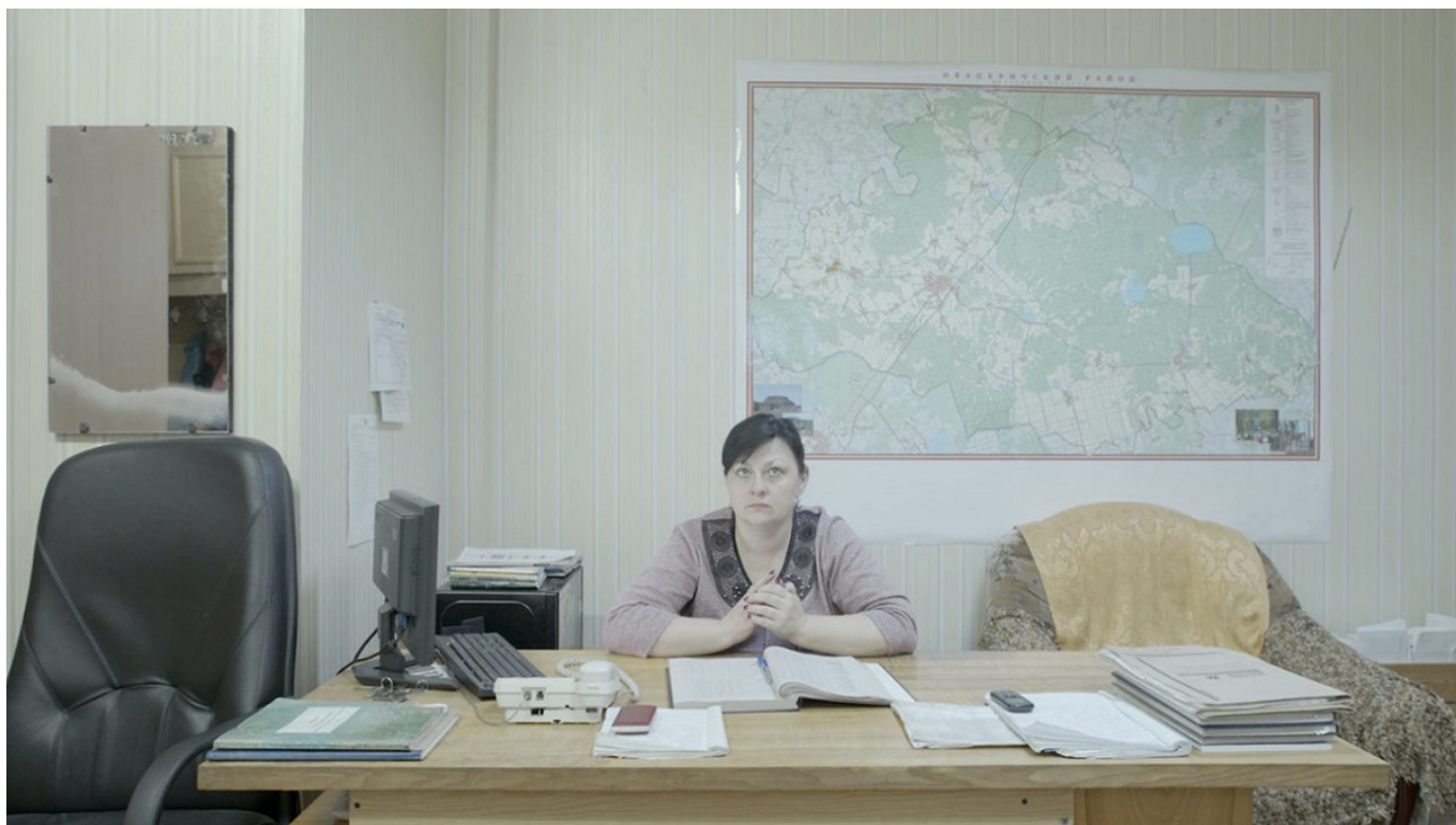
Кадр из фильма «Ханская плоть».