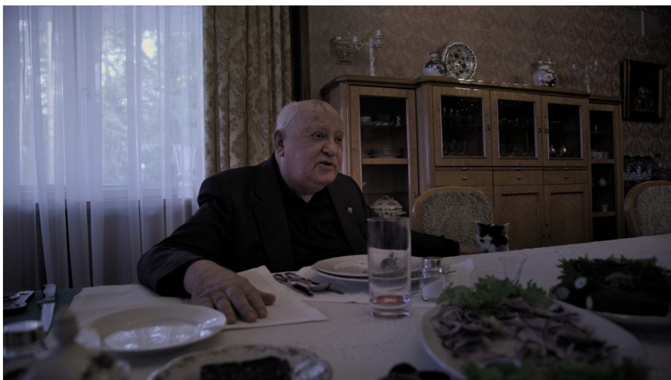
Кадр из фильма «Горбачев. Рай».

Автор: Заррина Салимова, Нион , 16.04.2021.