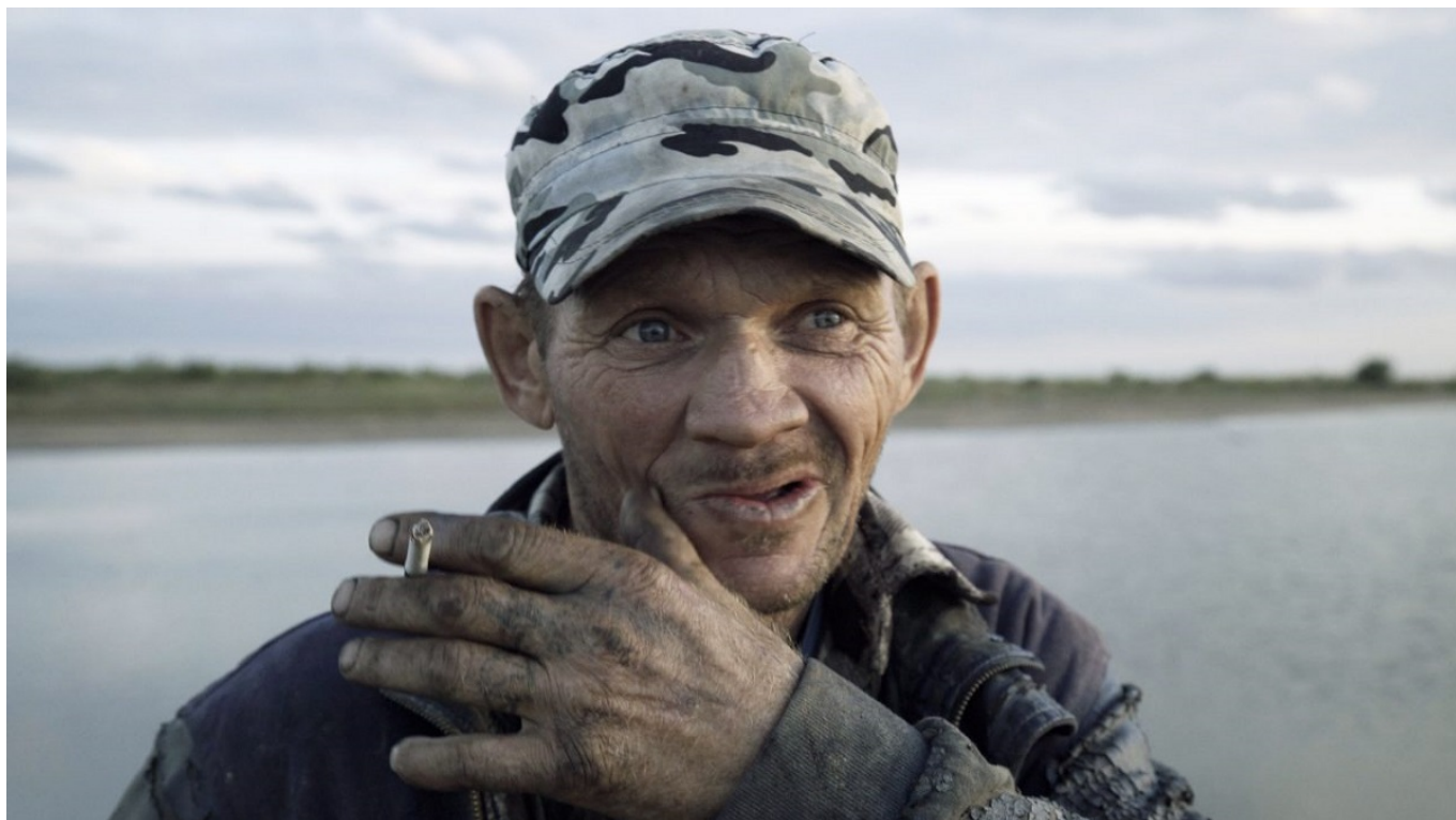
Кадр из фильма «Остров».