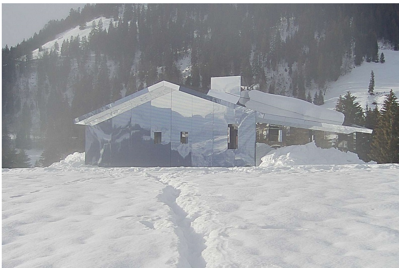
Фото инсталляции Mirage Gstaad, сделанное веб-камерой на сайте проекта Elevation1049.org

Автор: Заррина Салимова, Берн , 11.02.2021.