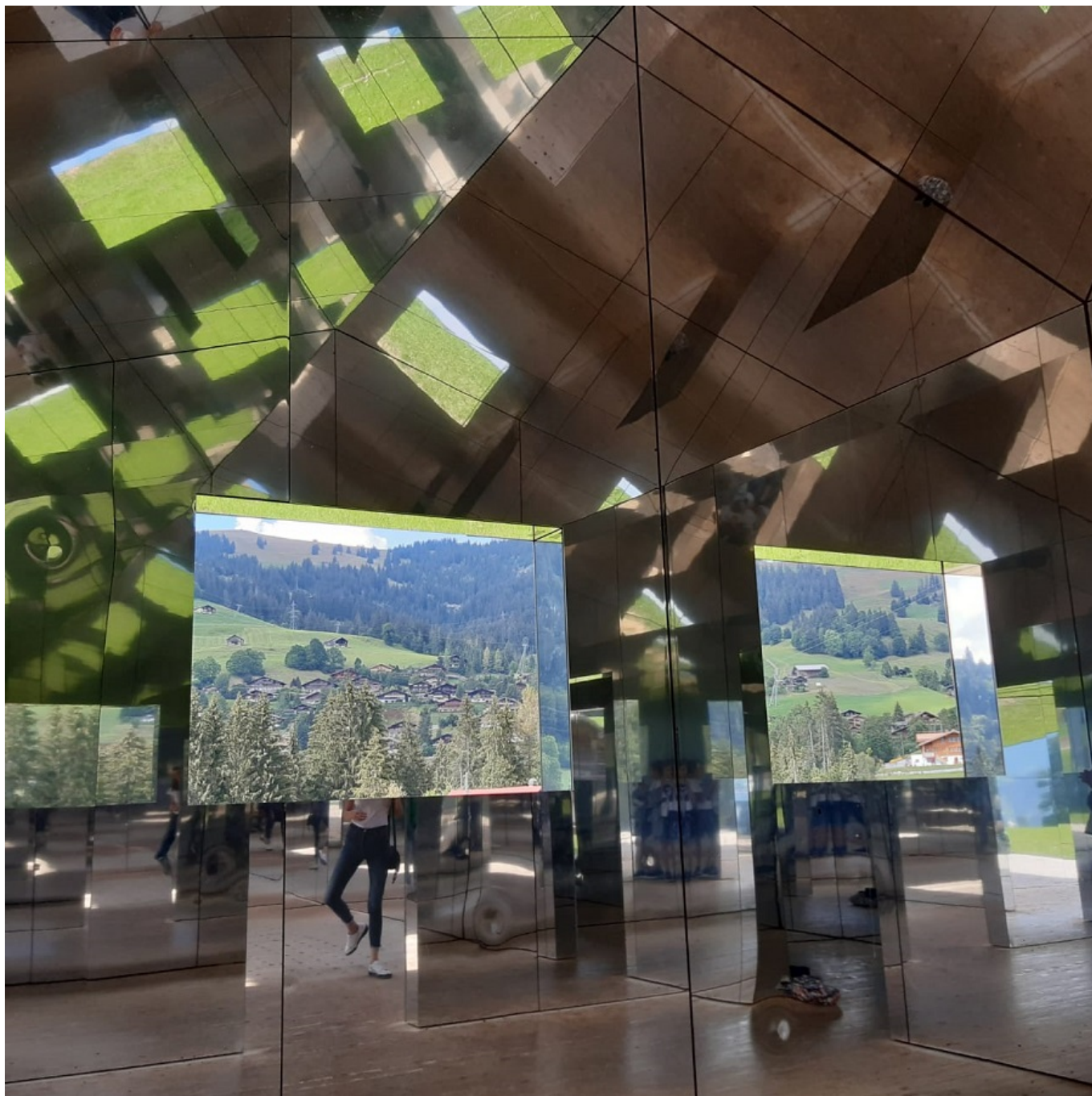
Внутри зеркального дома.

художника Дага Айткена Mirage Gstaad . Арт-объект представляет собой дом с зеркальными стенами. Здание расположено между Шенридом и Гштаадом в Бернском Оберланде, до него можно легко добраться пешком за 15-20 минут от железнодорожных вокзалов Шенрида или Грубена.