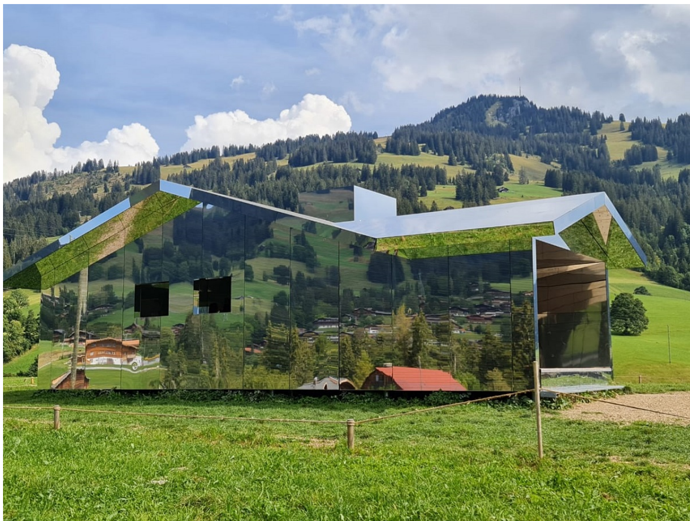
Зеркальный дом в Гштааде в прошлом сентябре.