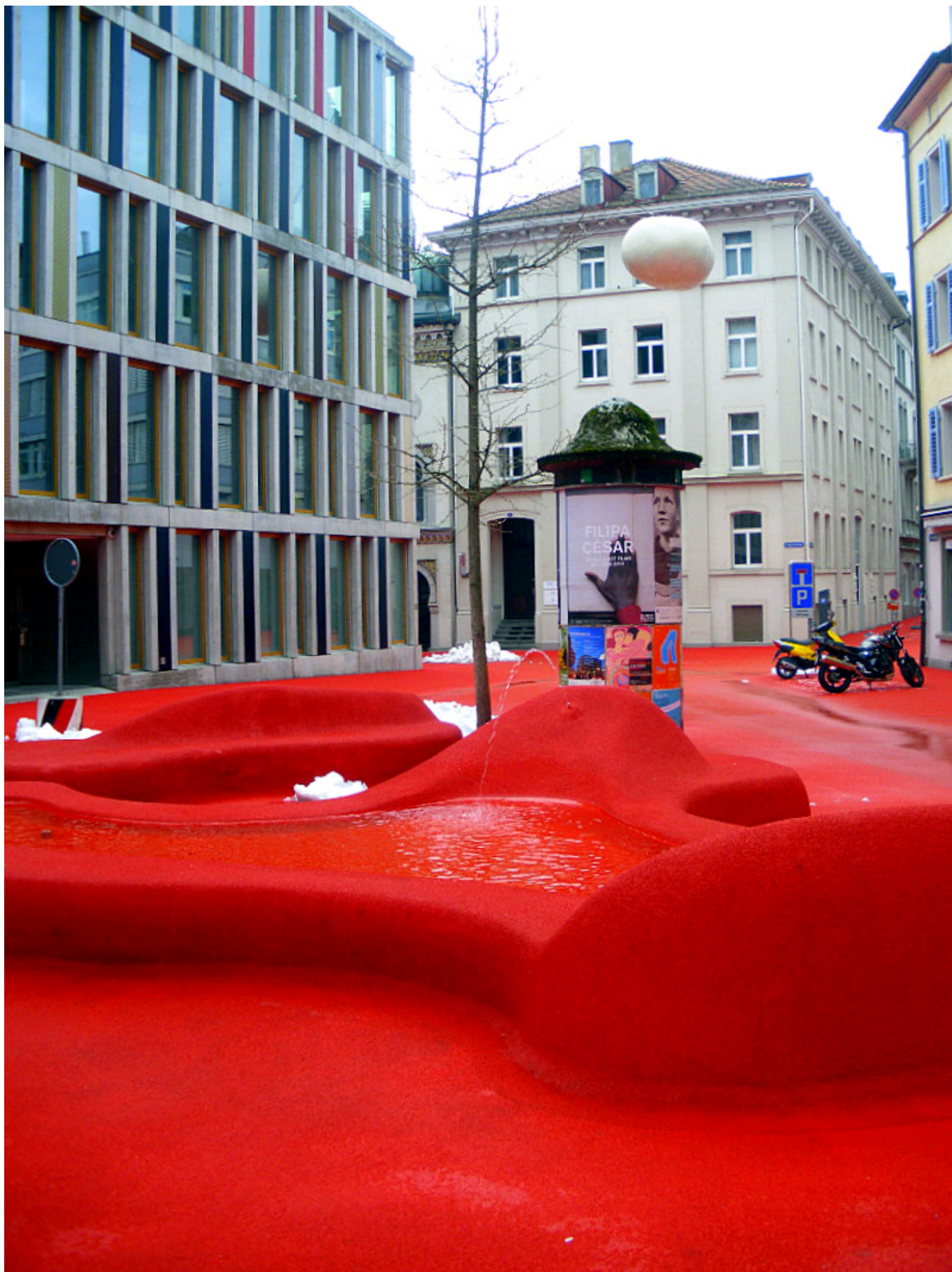
Красная площадь, но без Мавзолея.