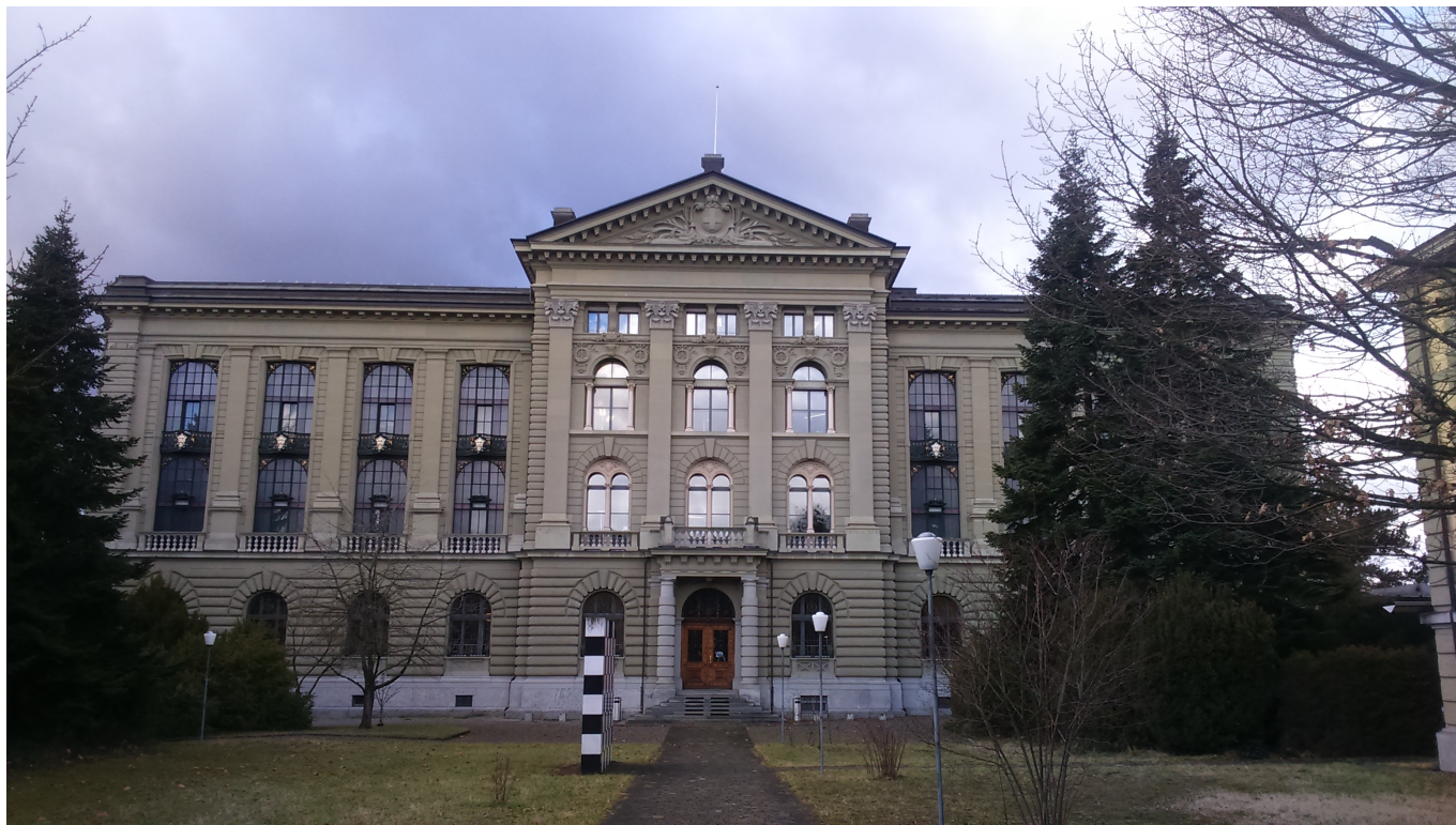
Федеральный архив Швейцарии

Федеральный архив в Берне и его богатейшие собрания объединяют все кантоны, все языки и администрации всех уровней. Солидная часть этих коллекций касается людей, дорогих для Нашей Газеты: русских и швейцарских иммигрантов и эмигрантов всех эпох, а также их потомков.