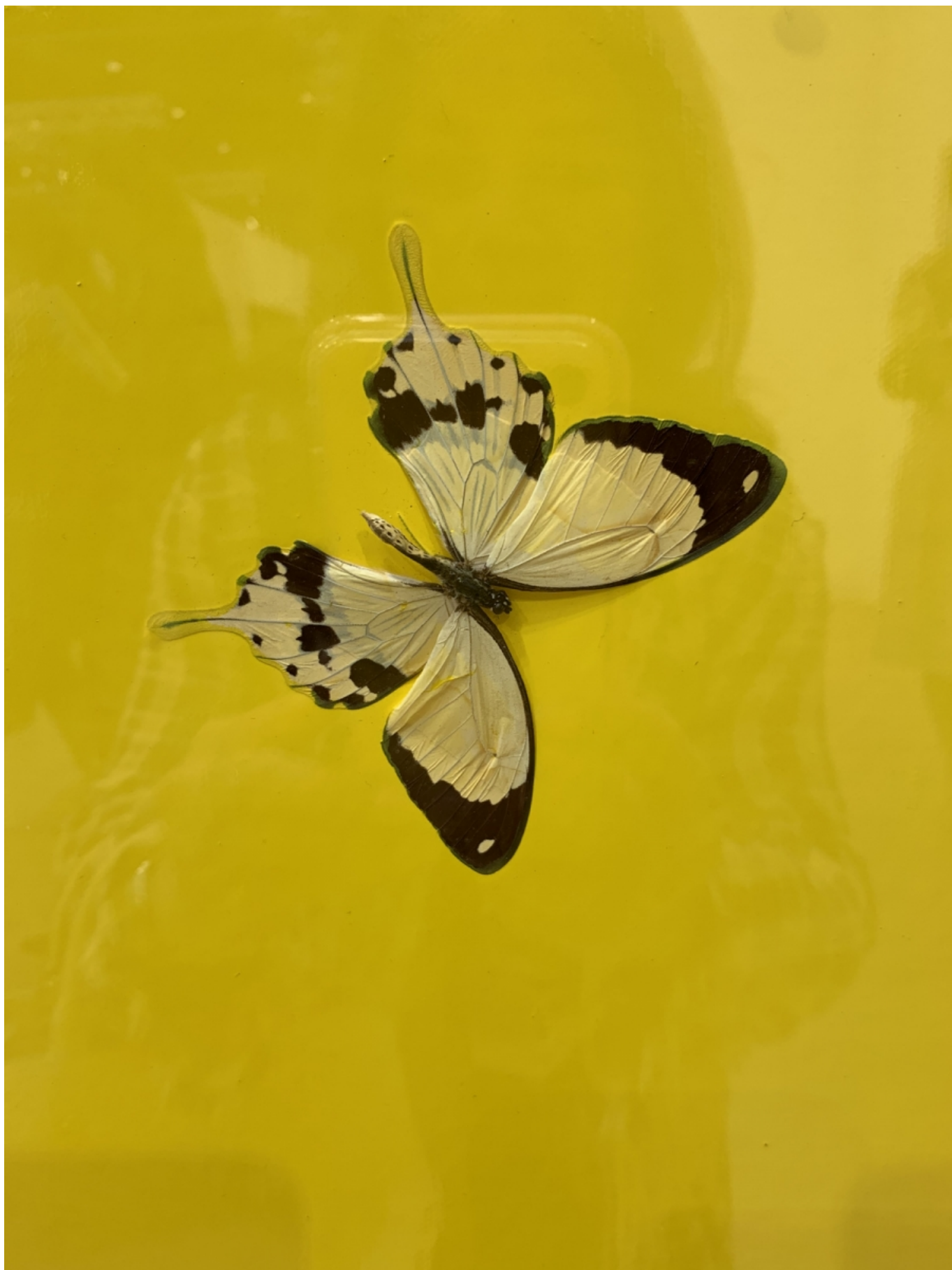
Damien Hirst. How Lovely Yellow is, 2006

Отметили мы две небольших работы Эрика Булатова , выставленные впервые