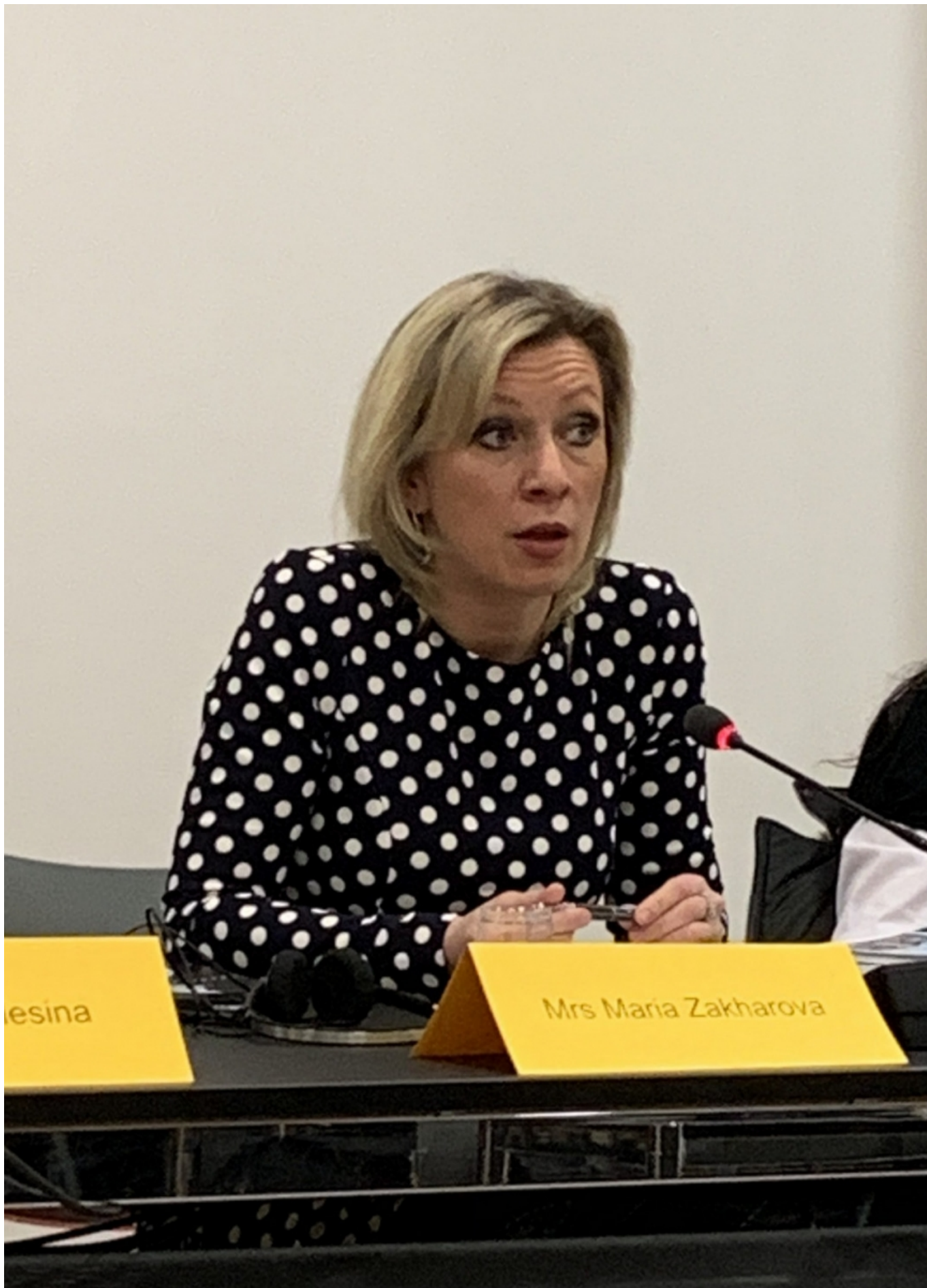
Мария Захарова