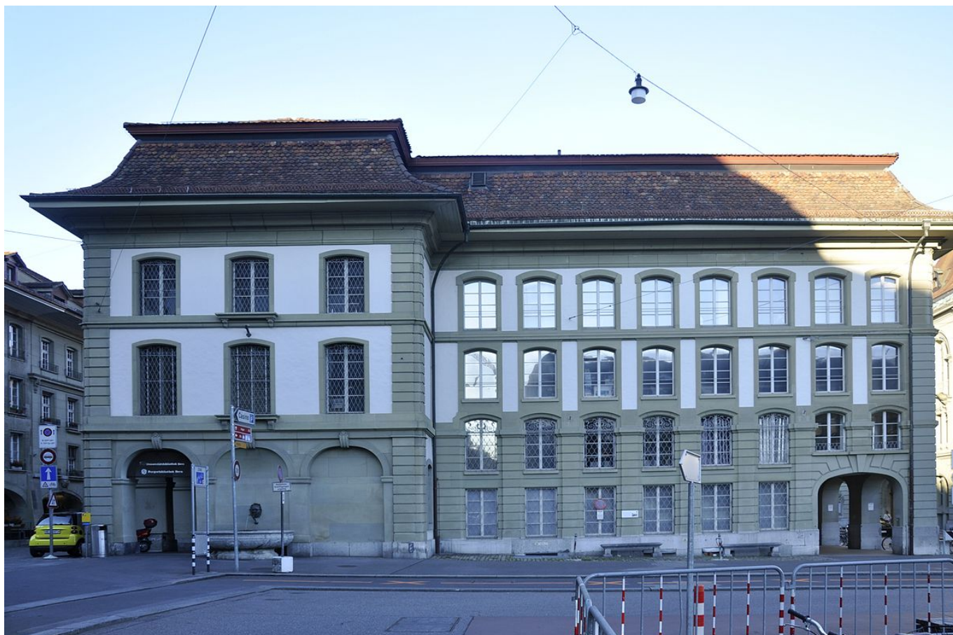
Здание Университета Берна

Угроза «коммунистического переворота» в Европе казалась Петеру Загеру реальной, поэтому сразу после войны он начал издавать собственный информационный бюллетень «Свободная корреспондентская служба» (нем. «Freie Korrespondenz-Dienste»). Политологическое образование Загер продолжил в Бернском университете, который закончил в 1952 году, защитив диссертацию на тему «Теоретические основы сталинизма и их влияние на экономическую политику Советского Союза» и получив степень доктора политологии. Антисоветское направление своих исследований Загер развил в Гарвардском университете в США, где он сначала два года учился на курсе «Программа Советского союза», а потом работал в качестве стипендиата Русского исследовательского центра. Когда в 1956 году в Венгрии вспыхнуло восстание, Загер, не закончив стажировку, вернулся в Берн с твердым намерением организовать информационную службу по борьбе с коммунизмом.