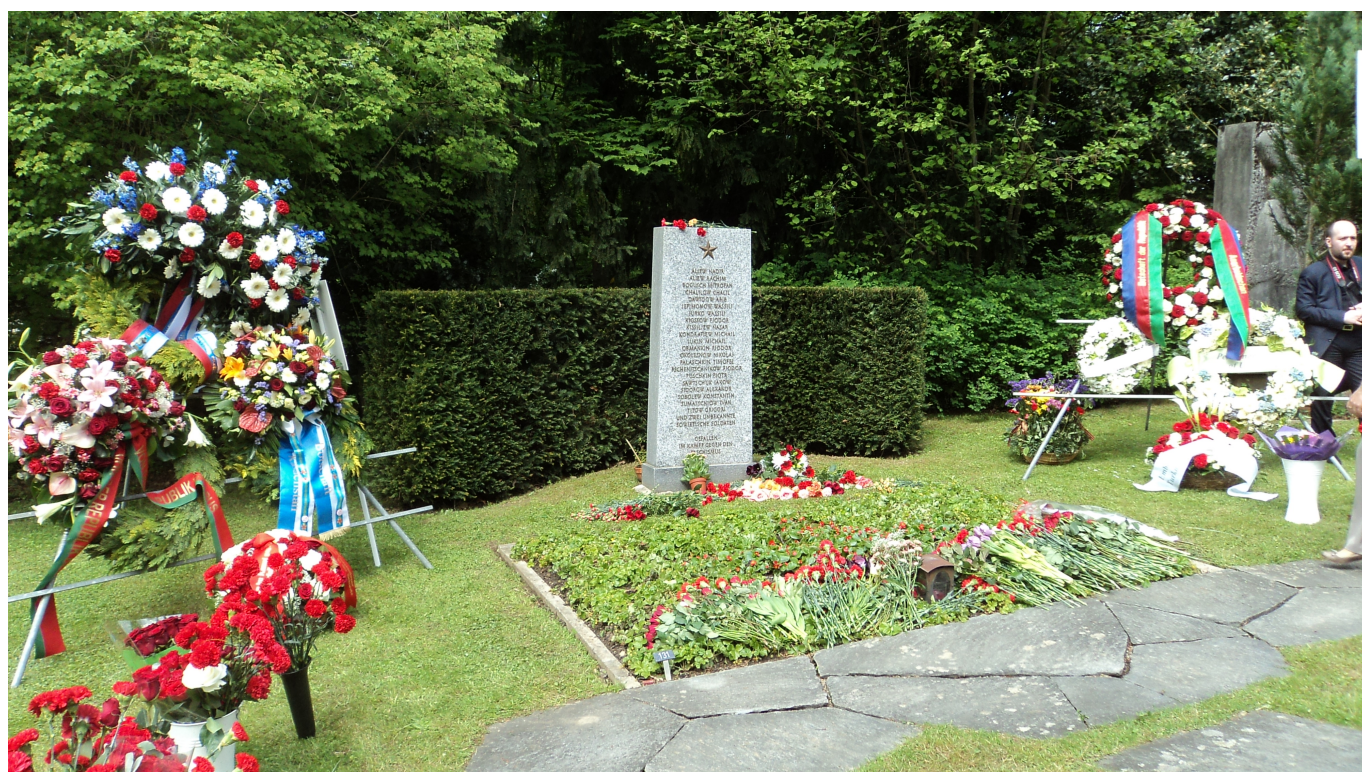
Памятник советским солдатам на кладбище Хернли в Базеле с фамилией Пшеничникова. (И. Грезин/Nashagazeta.ch)

Автор: Иван Грезин, Базель - Bâle , 08.05.2018.