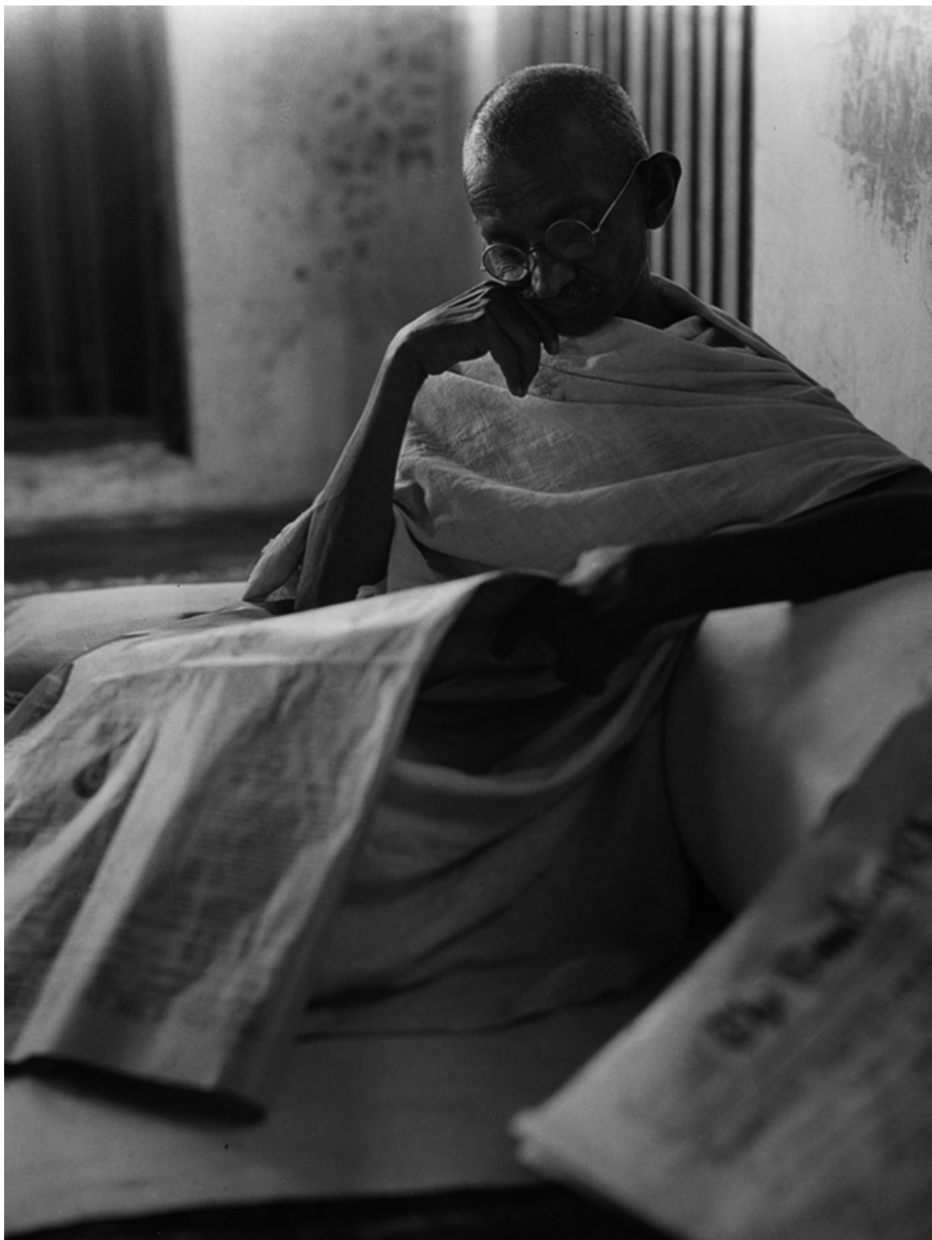
Махатма Ганди на фотографии швейцарского репортера Вальтера Боссхарда, 1930 (masilugano.ch)

Выставка, которая продлится до 21 января 2018 года, является частью проекта культурного центра Лугано LAC (Lugano Arte e Cultura) под названием Focus India,