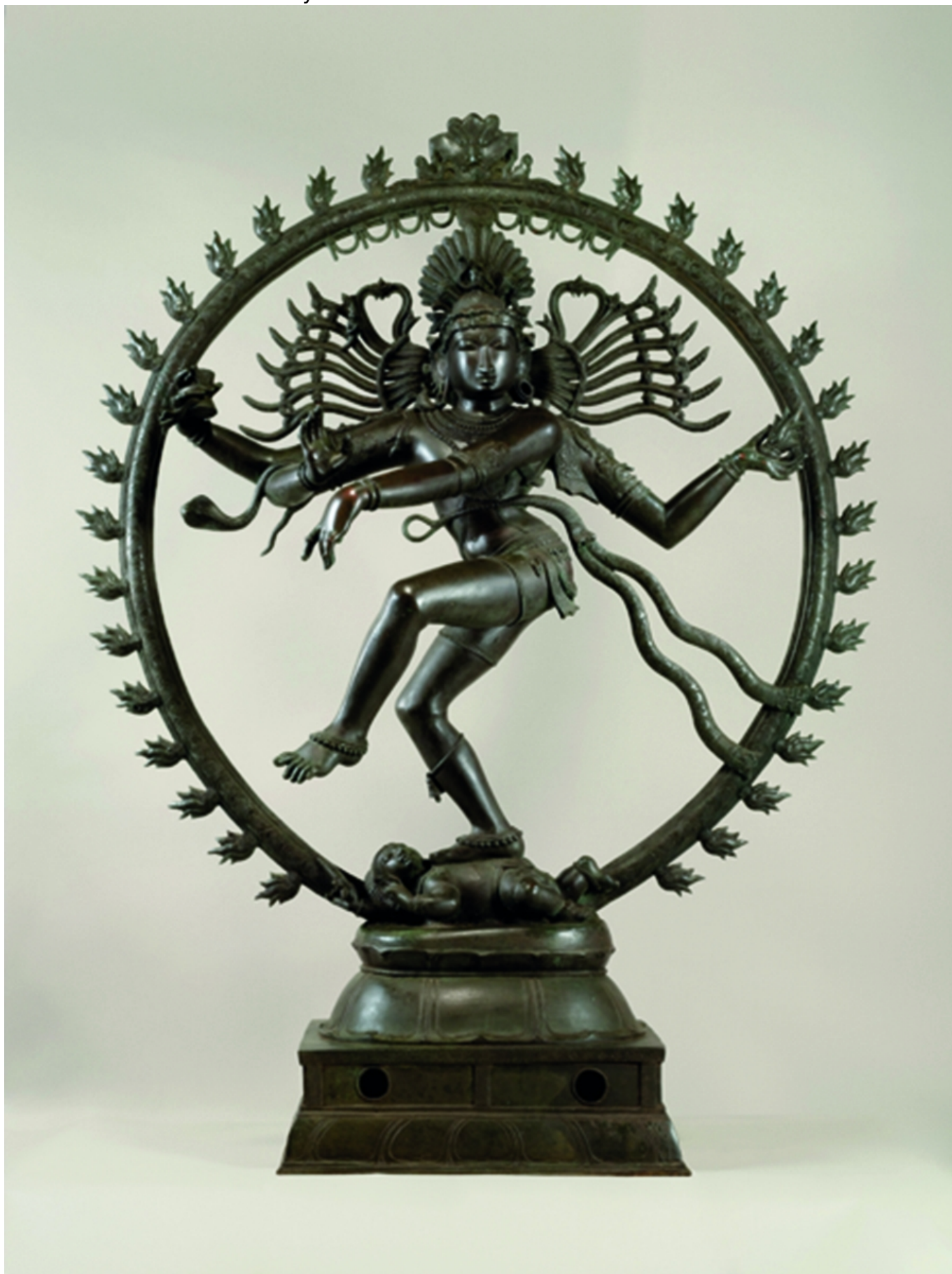
Шива Натараджа - король танца

Индией - с ее традициями, религиями, пейзажами и культурами - постепенно охватывало западные страны, а также разные формы европейского искусства, отмечается в коммюнике музея.