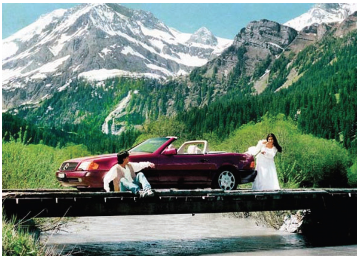
Индийцы любят снимать фильмы в Швейцарии

Знаменитости тоже любили сниматься на фоне альпийских пейзажей. Элизабет Тейлор прокатилась за рулем автомобиля с откидным верхом в окрестностях Сильваплана (кантон Граубюнден), Стив Маккуин промчался на мотоцикле перед табличкой с надписью «Achtung Schweizer Grenze» (нем.: «Внимание: швейцарская граница»). Аль Пачино в Лейкербаде столкнулся нос к носу с коровой и здорово испугался. Роберт Редфорд катался в Конфедерации на лыжах, Марианна Фейтфул ела фондю, за Дженнифер Коннелли гнался изуродованный парень, герой Фрэнка Синатры бежал в Конфедерацию из фашистской Италии, Лорел и Харди карабкались по альпийским склонам в компании сенбернара. Радж Капур снял здесь свой знаменитый «Сангам» и положил начало паломничеству индийских кинематографистов в швейцарские Альпы – с тех пор каждый уважающий себя режиссер Болливуда считает своим долгом снять в Швейцарии несколько эпизодов для очередной зрелищной картины.