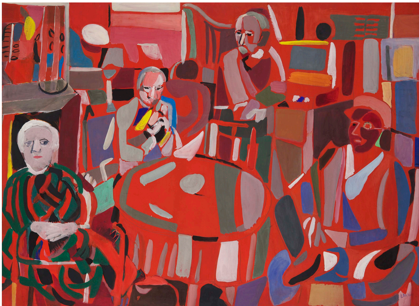
Андрей Ланской (1902-1976). "Без названия", около 1930 г. Гуашь, бумага, 73 x 100 см