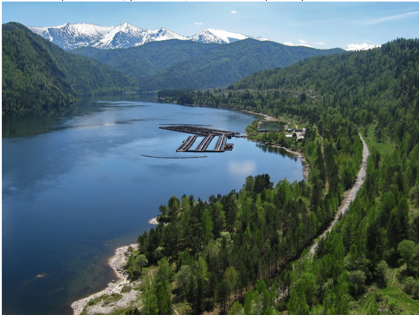
Хакасия - Сибирская Швейцария

Можно ли найти сходство между Швейцарией и сибирской тайгой?.. Оказывается, что можно, если тайга находится на территории республики Хакасия. Именно эти сказочные заповедные места принято считать местной Швейцарией. По результатам исследования климата, проводившегося в 80-х годах прошлого столетия, Хакасия была признана местом с самыми благоприятными для жизнедеятельности человека условиями. Здесь можно увидеть и жаркие степи, и заснеженные вершины гор, и густую тайгу, и великую реку Енисей... А еще в Хакасии, по свидетельствам ученых, находится более 30 тысяч археологических памятников – от наскальных рисунков до курганов, от городищ до древних изваяний, благодаря чему республику называют не только Сибирской Швейцарией, но еще и Меккой сибирской археологии.