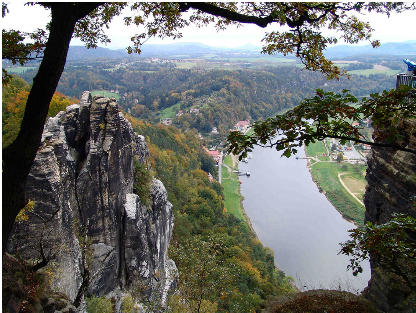
Песчаниковы горы - Саксонская Швейцария