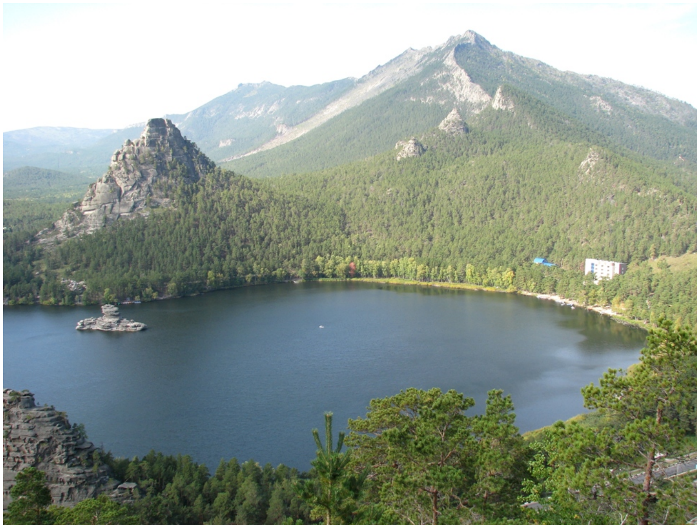
Курорт Боровое в Казахстане - чем не Швейцария?