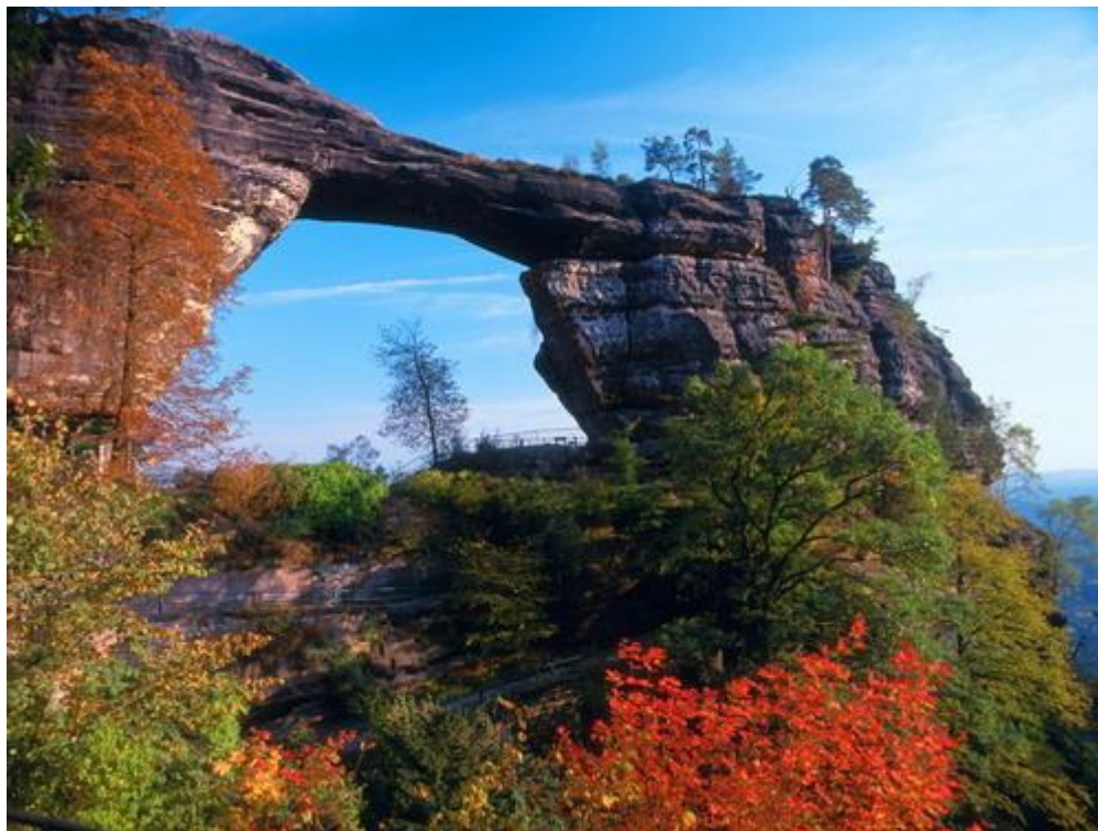
Правчицка Брана, Чешская Швейцария