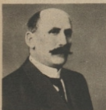
M. Calonder était à la tête du Département politique fédéral lorsque le Conseil fédéral expulsa la mission Bersine, coupable d'avoir trépidé dans la grève générale de 1918.

Toutefois, ce chemin était parsemé d'obstacles. A chaque fois que s'esquissait un rapprochement, des événements survenaient et se mettaient à la travers, de telle sorte que l'on avait de part et d'autre des griefs à faire valoir. Notre peuple a toujours éprouvé une