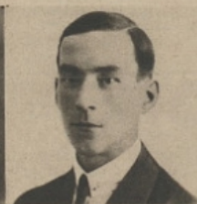
Conrad, Grison de Russie où sa famille avait grandement souffert du fait de la révolution, crut se venger en abattant à Lausanne le député russe Vorovsky. Conrad fut acquitté, ce qui provoqua le boycott de la Suisse par la Russie et un conflit qui ne fut réglé qu'en 1927.