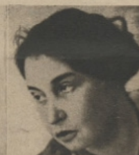
Ang. Balabanoff, épistémologue communiste, ancienne collaboratrice de Mussolini à l'« Avanti », fut expulsée de Suisse pour avoir contribué à fomenter la grève générale de 1918.