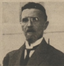
Vladislav Vorovsky, député soviétique à la Conférence de Lausanne, en 1923. Son assassinat par Conrad ne fut pas considéré par la Suisse comme un meurtre politique, étant donné que les puissances n'avaient pas voulu reconnaître à Vorovsky le caractère de député.