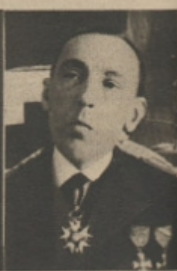
† Amiral Bard, ambassadeur de France à Berne, est mort à 55 ans. Il fut les deux guerres mondiales, puis fut un temps préfet de police de Paris. L'amiral était à Berne depuis 1942.

Chasseur allemand attaquant des bombardiers américains. Ne dirait-on pas exactement ce qui s'est passé au-dessus de Schaffhouse? Un appareil de nationalité inconnue attaque, en effet, les avions américains qui, au nombre de trente, envahirent le ciel de la cité du Munot.