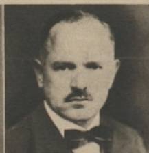
M. Robert Grimm, député socialiste de Berne au Conseil national, se rendit en 1917 en Russie d'où il demanda télégraphiquement au conseiller fédéral Hoffmann de s'informer au sujet des conditions de paix que les Centraux pourraient faire aux Russes. Son télégramme et la réponse de Hoffmann furent interceptés. Grimm, tsaï d'opinion allemande, fut expulsé de Russie et Hoffmann dut démissionner.