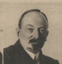
Tchitchérine, commissaire soviétique aux Affaires étrangères, n'admit pas le point de vue de la Suisse dans l'affaire Vorovsky et envoya au Conseil fédéral deux télégrammes si offensants que notre gouvernement renoua à répondre au second. Ainsi se produisit la rupture entre les deux Etats.