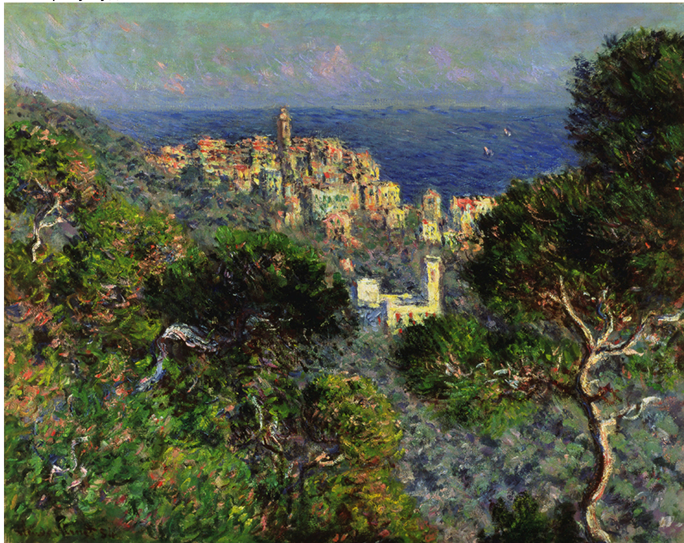
Клод Моне. "Бордигера", 1884. Масло, холст, 66 x 81,8 см (The Armand Hammer Collection, donation of la Armand Hammer Foundation. Hammer Museum, Los Angeles) музеи в Швейцарии

Ну, и отдельный зал «выделен» под многочисленные изображения собственного сада Моне в Живерни – если вы там не бывали, то после Базеля (выставка работает до 28 мая) сразу туда!