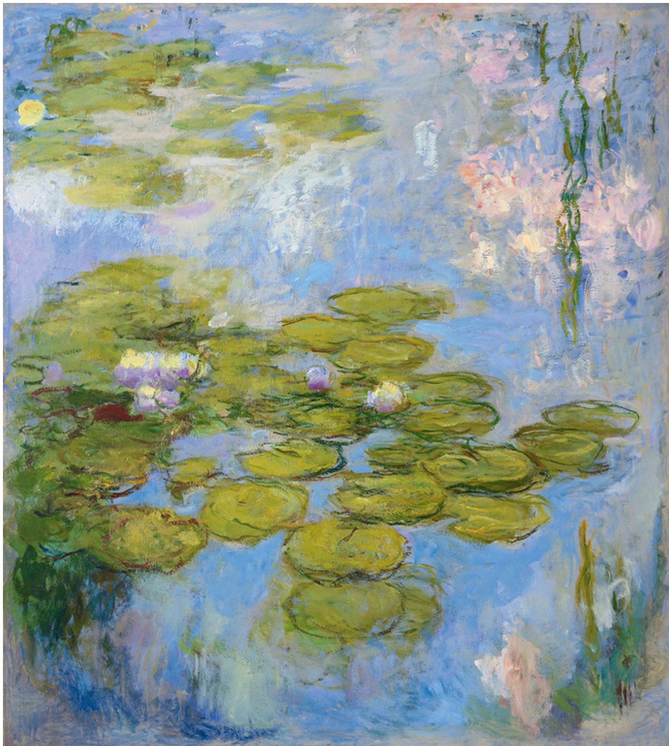
Клод Моне. "Кувшинки", 1916-1919 Масло, холст, 200 x 180 cm (Fondation Beyeler, Riehen/Bâle, Collection Beyeler)