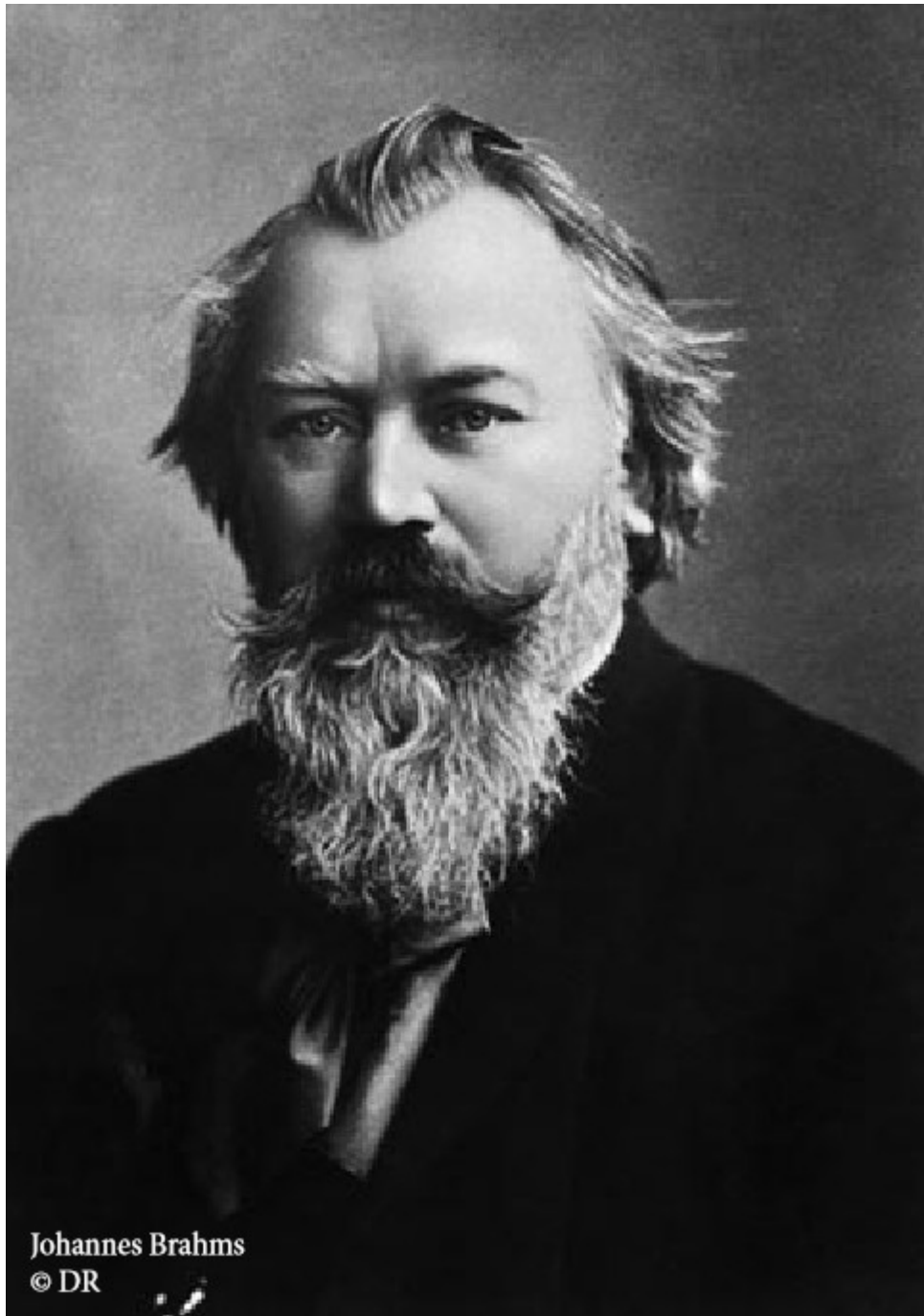
Иоганнес Брамс (1833-1897)

В 2009 году, блестяще дебютировав с Национальным молодежным оркестром Великобритании, он стал главным дирижером коллектива и оставался на этом посту до 2013 года. С Ливерпульским филармоническим и Национальным молодежным оркестром Великобритании дирижер неоднократно участвовал в фестивале BBC Proms. С сезона 2013/14 Петренко занимает должность главного дирижера Филармонического оркестра Осло (Норвегия).