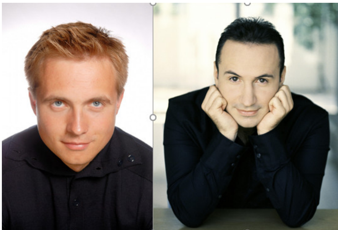
Василий Петренко и Симон Трпчески