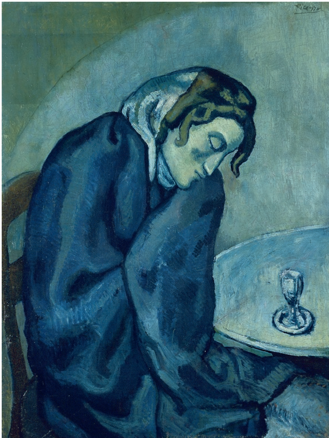
Пабло Пикассо. Пьяная уставшая женщина, 1902. ( Поступление 1979 г.)

Сразу после окончания Второй мировой войны началась работа по их реституции владельцам или их наследникам и по возмещению убытков. Начиная с 1990-х годов, интерес общественности к этому вопросу неуклонно растет как в Швейцарии, так и в других странах. Вот почему весной 1998 года Федеральный департамент культуры опубликовал доклад о состоянии исследований, касающихся провенанса культурных ценностей Конфедерации. Этот доклад вывел на первый план вопрос об украденных похищенных предметах искусства. Чуть позже в том же году появилось еще одно исследование, на этот раз касавшееся роли Швейцарии как места торговли