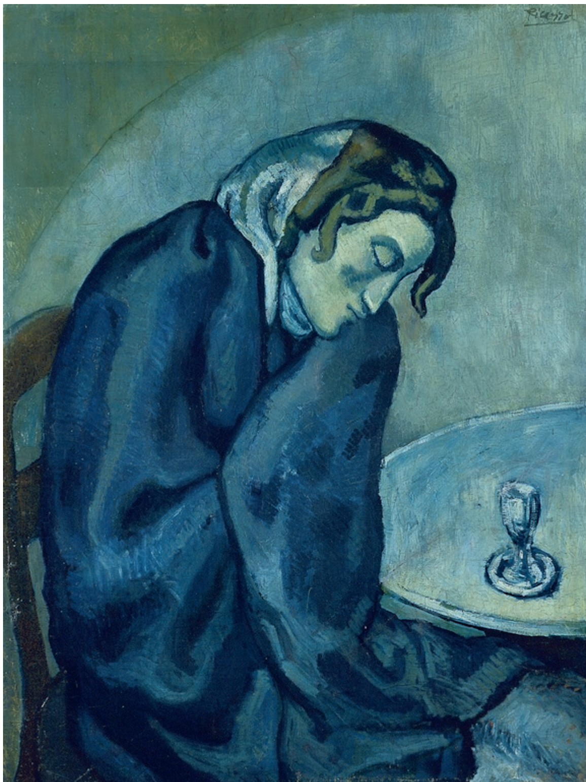
Пабло Пикассо. Пьяная уставшая женщина, 1902. ( Поступление 1979 г.)

Сразу после окончания Второй мировой войны началась работа по их реституции владельцам или их наследникам и по возмещению убытков. Начиная с 1990-х годов, интерес общественности к этому вопросу неуклонно растет как в Швейцарии, так и в других странах. Вот почему весной 1998 года Федеральный департамент культуры опубликовал доклад о состоянии исследований, касающихся провенанса культурных ценностей Конфедерации. Этот доклад вывел на первый план вопрос об украденных похищенных предметах искусства. Чуть позже в том же году появилось еще одно исследование, на этот раз касавшееся роли Швейцарии как места торговли