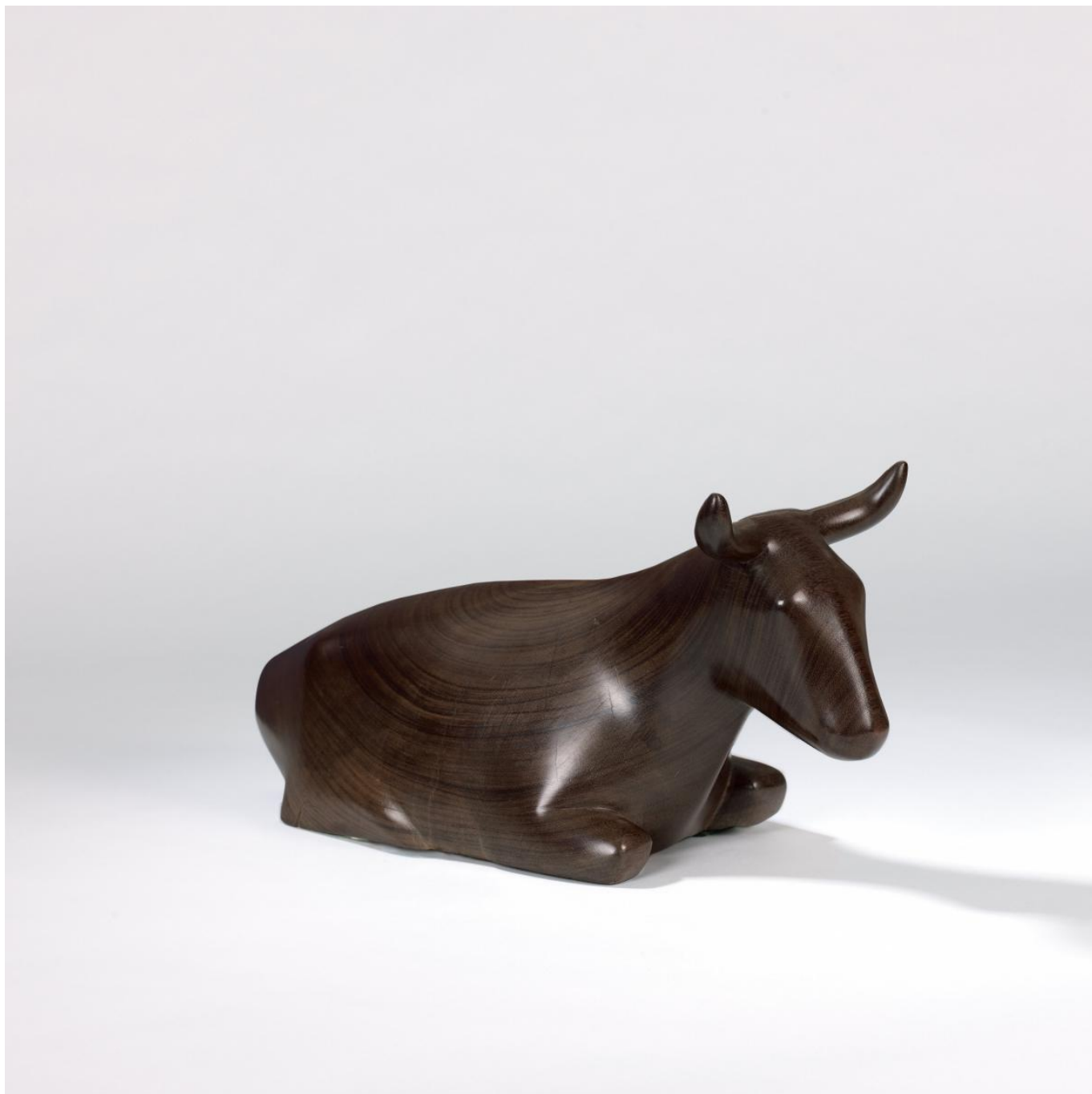
Эвальд Матаре. "Лежащая корова", 1925 г. (. Поступление 1962 г.)