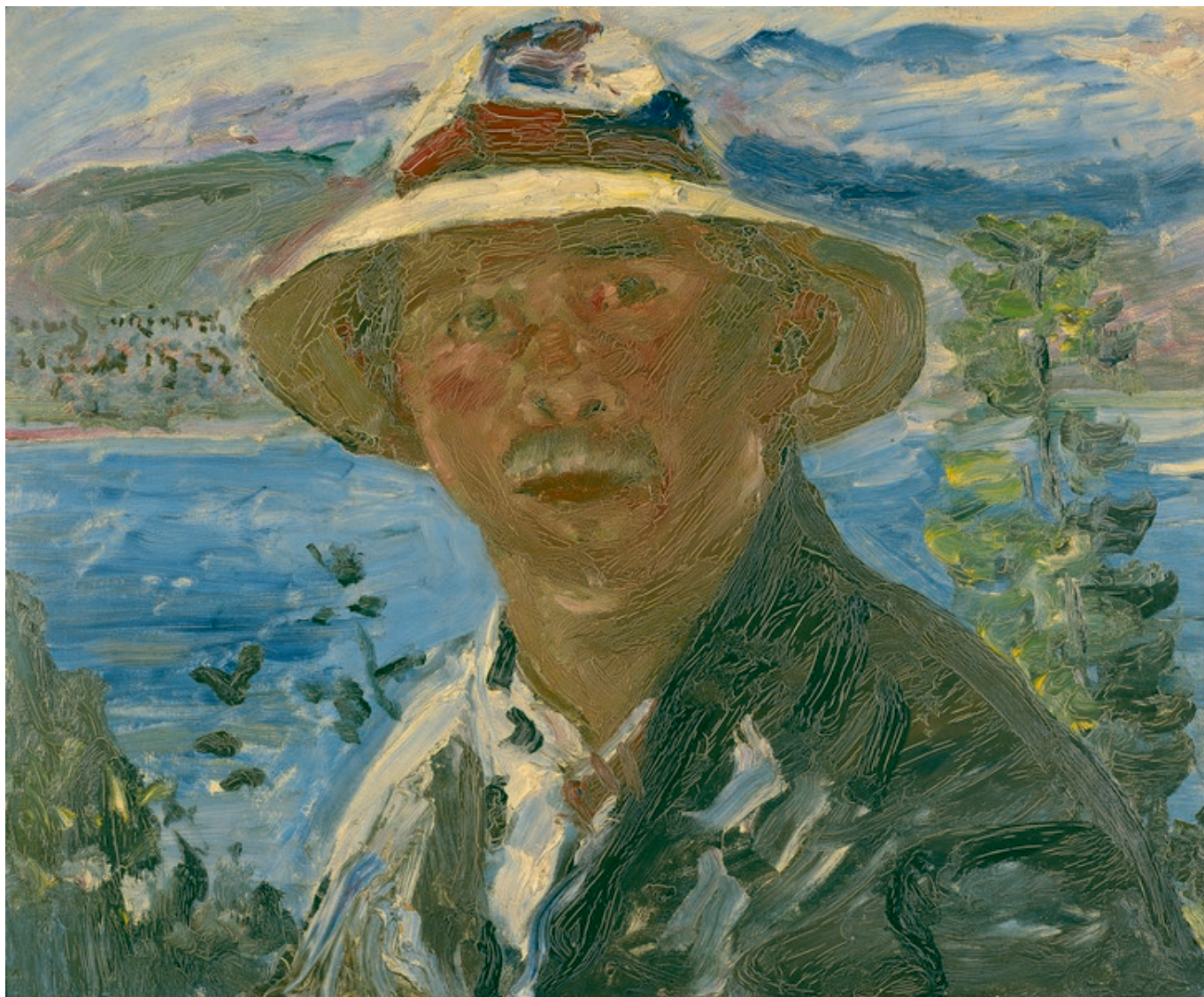
Ловис Коринт. "Автопортрет", 1923.

Автор: Надежда Сикорская, Берн , 07.04.2016.