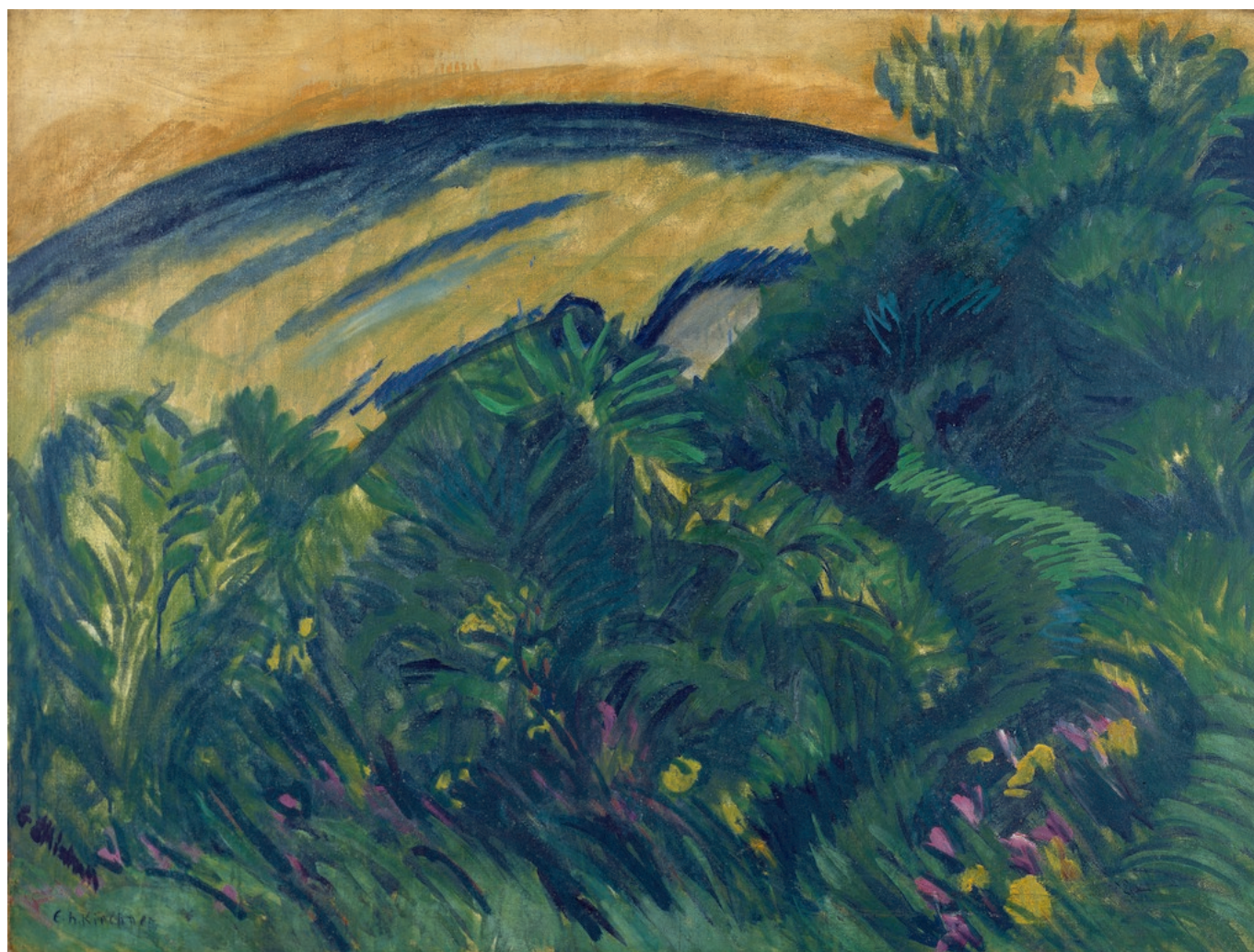
Эрнст Людвиг Кирхнер. "Дюны и море", 1913. (© Kunstmuseum Bern, Staat Bern, поступление 2000 г.)

«Скажем ясно: «дегенеративного» искусства не существует, - со всей определенностью заявляют организаторы выставки. - Это понятие родилось из политического дискурса немецких национал-социалистов, и ничто не указывает на то, что оно использовалось швейцарским музеем, всегда, во все эпохи своего существования интересовавшимся «современным» искусством».