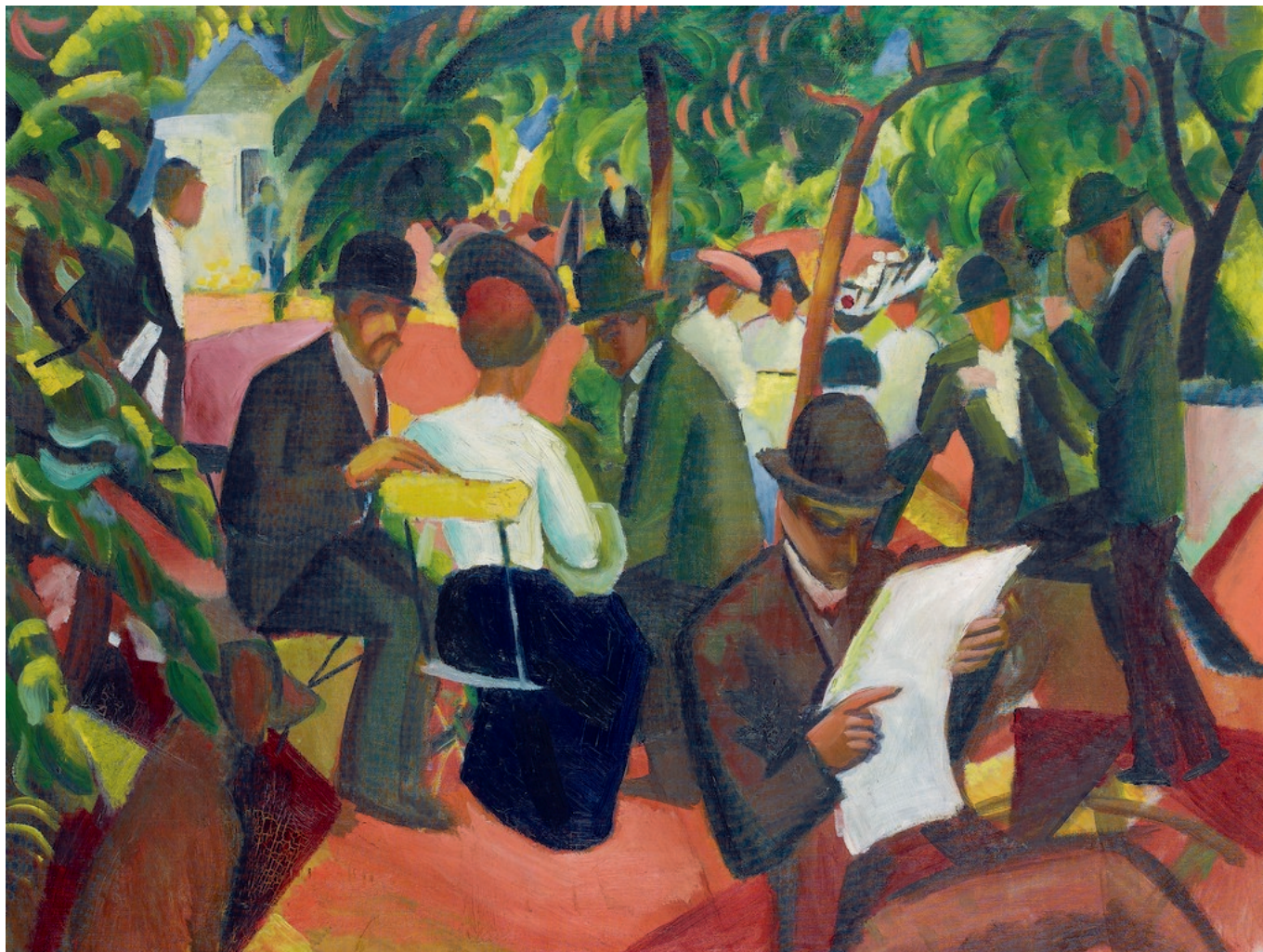
Август Маке. "Ресторан в саду", 1912 г. (© Kunstmuseum Bern/Hermann und Margrit Rupf-Stiftung. Поступление 1979 г.)

сайте Федерального департамента культуры , появилось приглашение ко всем музеям и прочим художественным собраниям страны, заинтересованным в прояснении и предании огласке происхождения принадлежащих им или хранимых ими культурных ценностей, подать соответствующую заявку. Половину расходов (максимально 100 тыс. шв. франков в каждом случае) министерство обязуется взять на себя.