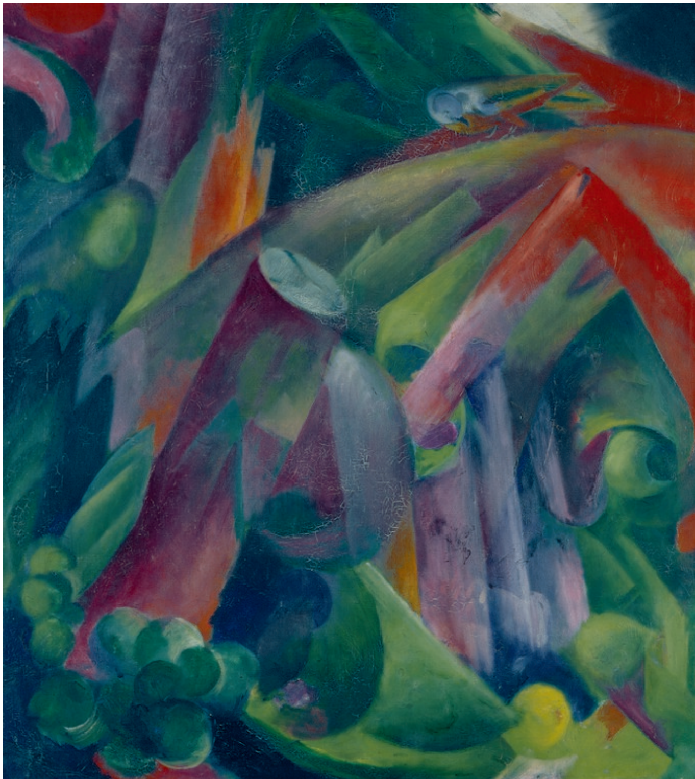
Франц Марк. "Птицы в лесу. (Голубь)", 1912 г.

Название выставки не случайно. Оно воспроизводит название аукциона, прошедшего в 1939 году в галерее Fischer в Люцерне – благодаря проведенным исследованиям, подробности этой приобретшей историческое значение продажи теперь хорошо известны. Назывался аукцион «Картины и скульптуры мэтров современного искусства из немецких музеев». Стоит пояснить, что в 1938 году Рейх издал «закон, касающийся конфискации произведений дегенеративного искусства », который задним числом делал законным экспроприацию творений современного искусства и «чистку» коллекций германских музеев, к которой режим беззастенчиво приступил еще в 1937 году. Многие из того, что Рейх уничтожал и запрещал, используя термин