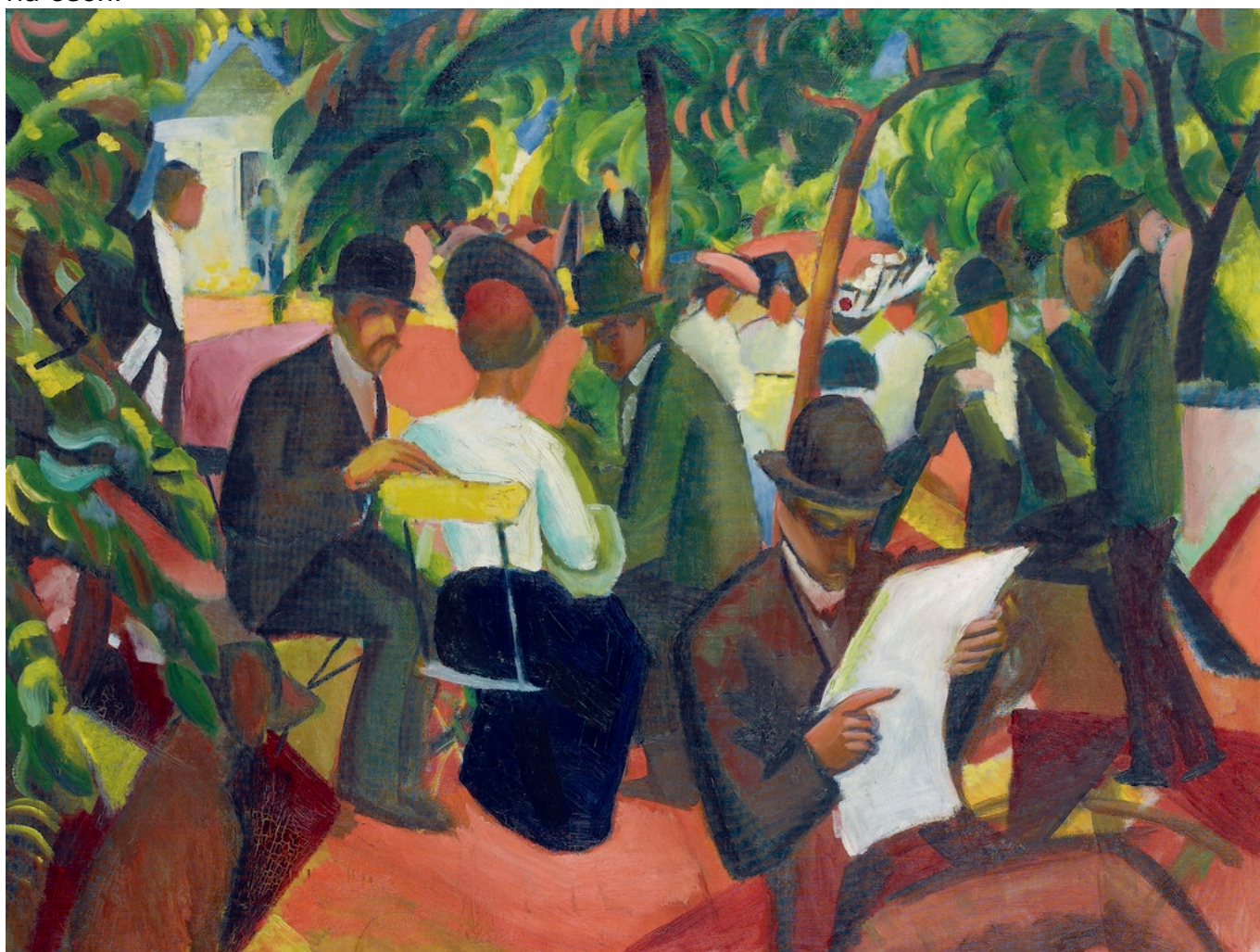
Август Маке. "Ресторан в саду", 1912 г.

Понятно, что подобная работа – дело хлопотное и затратное, но недавно министерство решило простимулировать тех, кто готов за нее взяться. Простимулировать чисто по-швейцарски, то есть франком. 21 декабря 2015 года на сайте Федерального департамента культуры , появилось приглашение ко всем музеям и прочим художественным собраниям страны, заинтересованным в прояснении и предании огласке происхождения принадлежащих им или хранимых ими культурных ценностей, подать соответствующую заявку. Половину расходов (максимально 100 тыс. шв. франков в каждом случае) министерство обязуется взять на себя.