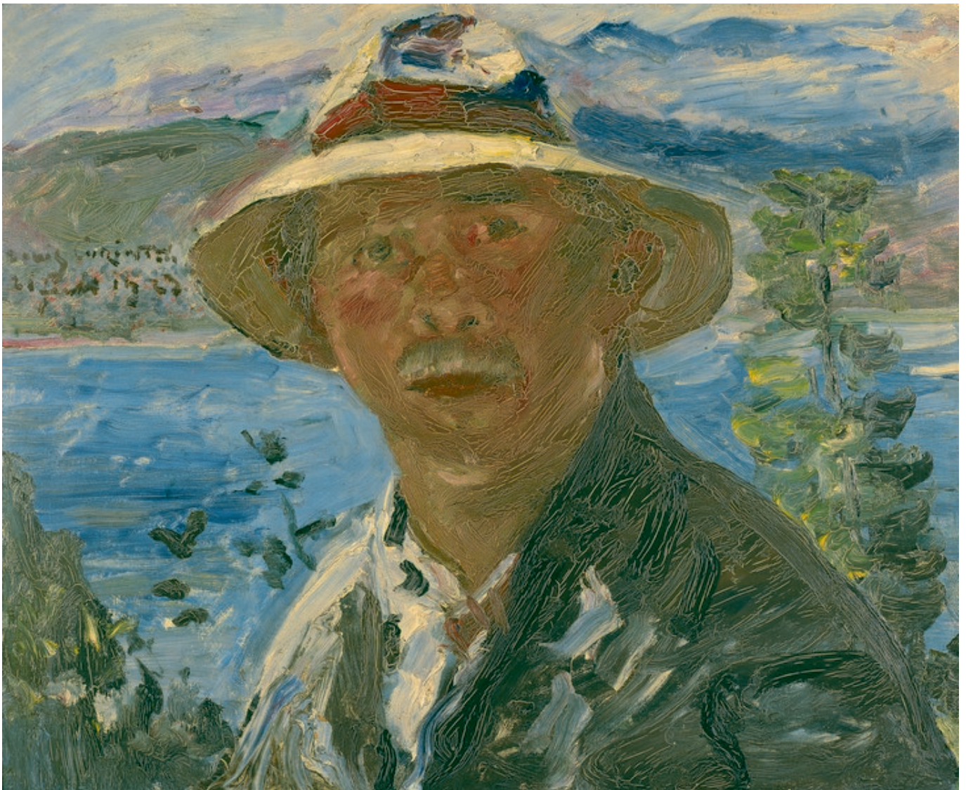
Ловис Коринт. "Автопортрет", 1923.

Автор: Надежда Сикорская, Берн , 07.04.2016.