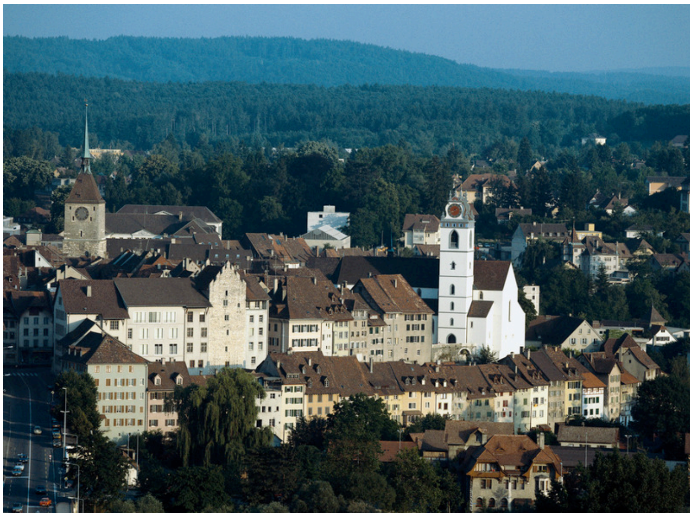
Вид на Арау, столицу кантона Аргау

Автор: Татьяна Гирко, Женева-Аргау , 28.03.2016.