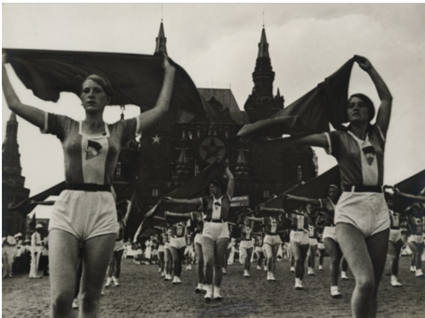
Девушки с платками, 1935 г. (mamm-mdf.ru)

Автор: Лейла Бабаева, Лугано , 02.03.2016.