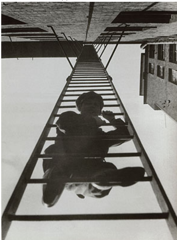
Пожарная лестница, 1925 г.

как художник, скульптор и оформитель, а фотоискусство исследовало и расширяло собственные возможности: взгляд «вглубь мира», исследование видимой реальности под разными углами. Взяв в руки фотоаппарат, Родченко провозгласил: «Наш долг – экспериментировать!», что привело к пересмотру роли фотографии. На передний план выступила концептуальность, снимки часто становились не иллюстрацией реальности, а средствами визуальной передачи интеллектуальных конструкций. Фото Родченко отличались резкими контрастами, были сделаны под смелым углом, также он создавал коллажи из текста и изображений.