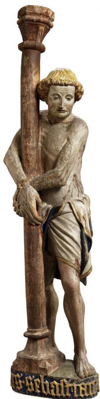
Статуя Святого Себастьяна, ок. 1450 г.

Исторический музей Вале (основан в 1883 году), а в соборе можно послушать самый старый действующий орган в мире: он был создан в 1430 году. Играют на нем во время ежегодного Фестиваля старинной органной музыки.