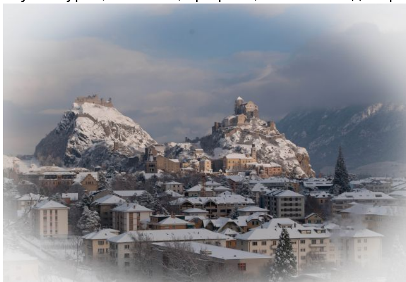
Сионские замки Валер и Турбийон зимней порой

На протяжении веков церковь не раз упрекали в злоупотреблении средствами изобразительного искусства, чрезмерной роскоши оформления, пышности, едва ли соответствующей строгому молитвенному духу. И все же история доказала, что именно красота спасет мир, и, где присутствуют высоконравственные идеалы, там и царят гармония и красота, которые находят свое выражение в картинах, скульптурах, лепнине, графике, элементах декора.