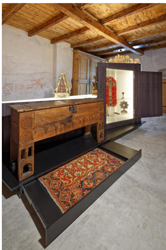
В выставочном зале (vs.ch)

Накануне Рождества город застыл в тихой дреме. И хотя в этом году зима не балует снежным убранством альпийских жителей, все равно в Сионе радуют глаз рождественские краски: мириадами огней зажглись фасады зданий, а над городом застыли в электрическом сиянии, словно два великана, охраняющих его покой, замки Турбийон и Валер.