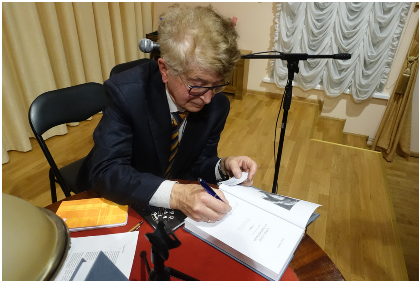
Жорж Нива раздает автографы

Третий повод для неприятия писателя связан с генералом Власовым. Обвинения во «власовщине» не имеет под собой оснований, ведь Солженицын в то время был на стороне красных. Посвященная Власову пьеса была у Солженицына украдена, передана в ЦК и послужила элементом в деле о его якобы предательстве. В театре же Александр Исаевич плохо разбирался, не понимал, что нельзя давить на режиссера, актеров.