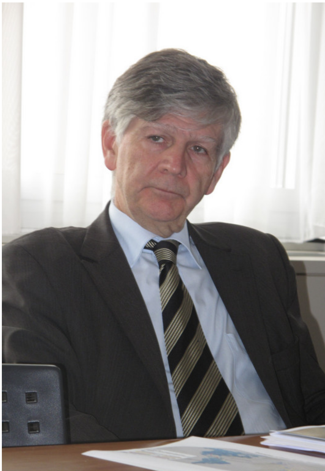
Профессор Вальтер Келин

Профессор Келин отметил, что, будучи юристом, вполне понимает правительства, настороженно относящиеся к изменению международных норм и не спешащие брать на себя дополнительную ответственность: сказываются и многочисленные объективные вопросы, и национальные приоритеты каждой страны. Но хорошо уже и то, что признана реальность проблемы и достигнуто понимание необходимости совместных действий, прежде всего, на региональном уровне.