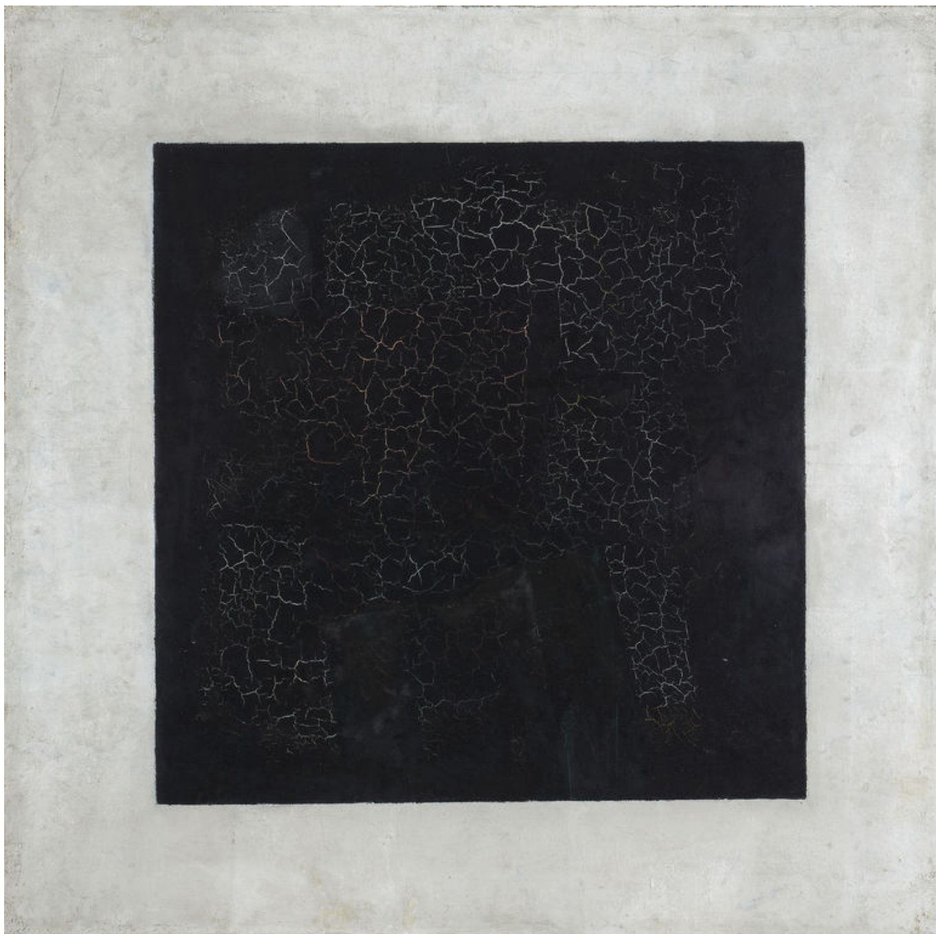
Казимир Малевич «Черный квадрат», 1929 г. Холст, масло, 79,2 x 79,5. (с) Государственная Третьяковская галерея, Москва

«При всей своей грандиозности фигура Малевича остается трагически недооцененной – ни современниками, ни более поздними поколениями соотечественников, ни мировой культурной общественностью, – поделился с «Нашей газетой.ch» Андрей Чеглаков, основатель Фонда AVC Charity Foundation, благодаря финансовой поддержке которого выставка в Базеле стала возможна. – Достаточно взглянуть на эстимейты на его картины – несмотря на то, что на аукционы они попадают крайне редко, цены не зашкаливают. А ведь речь идет о творениях человека, который концептуально изменил не только взгляд искусства на себя, но и взгляд человека на мир в целом».