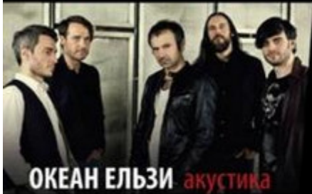
ОКЕАН ЕЛЗИ акустика

Ханс-Хубер-Зал Штайненберг 14, 4051 Базель