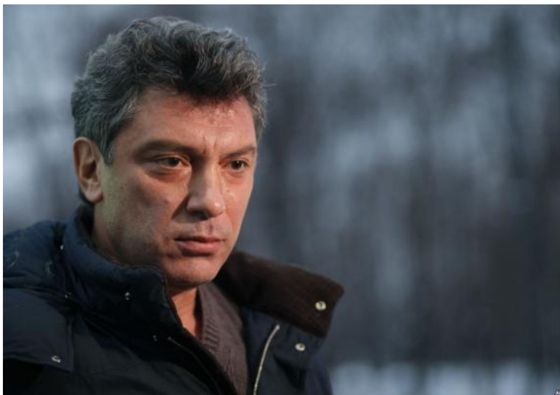
Борис Немцов (1959 - 2015)