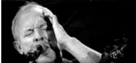
АНДРЕЙ МАКАРЕВИЧ вокал, гитара