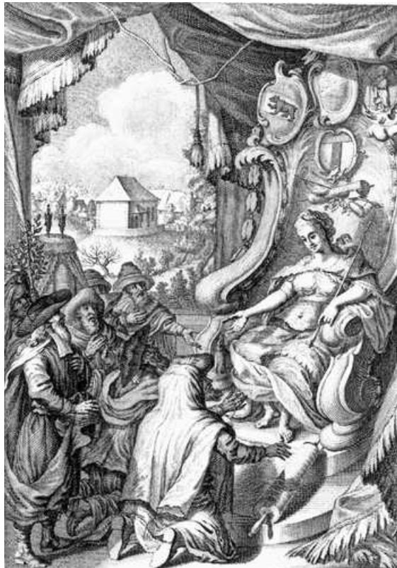
Гравюра Ганса Р. Гольжа: Евреи благодарят даму Гельвецию за ее гостеприимство, 1765 г.

В первой главе описаны священные предметы, относящиеся к иудейскому богослужению: арон кодеш (хранилище для свитков Торы), бима – возвышение для чтения Торы во время богослужения, и т.д. Автор рассказывает об особенностях иудейской архитектуры и интерьеров (светильники, окна, подсвечники, настенные росписи, символика), известных зодчих (в том числе о Готфриде Земпере (1803-1879), составившем в середине XIX века проект здания Федеральной политехнической школы Цюриха), о значении музыки в иудейском богослужении (орган и фисгармония), о священнических облачениях и проповедях.