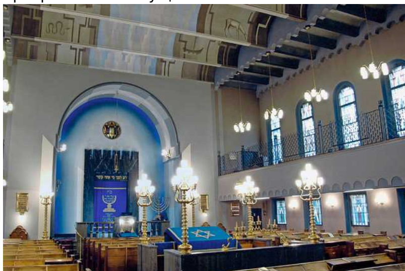
Внутреннее убранство синагоги на Freigutstrasse в Цюрихе