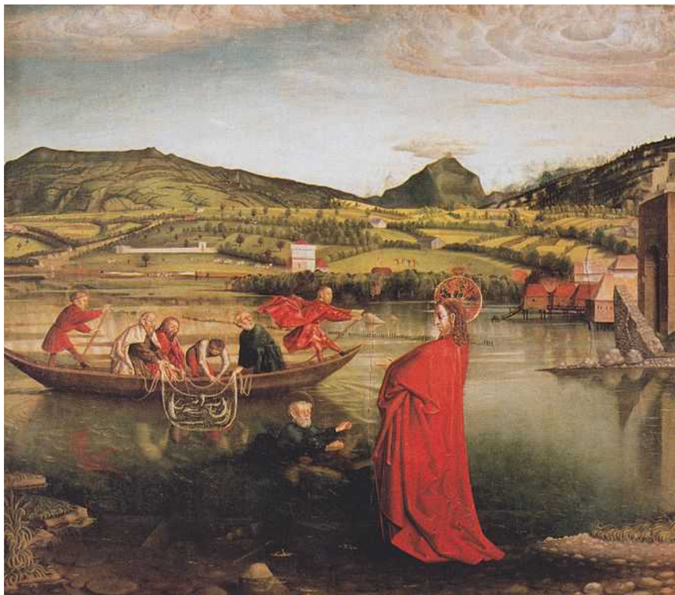
Конрад Виц «Чудесный улов рыбы», 1444

Автор: Лейла Бабаева, Женева , 08.11.2013.