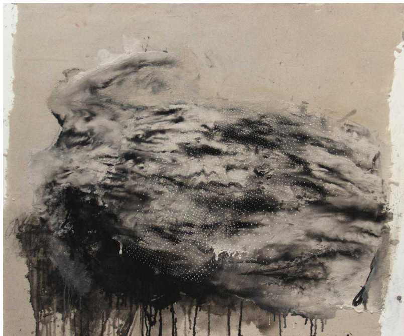
"Без названия"