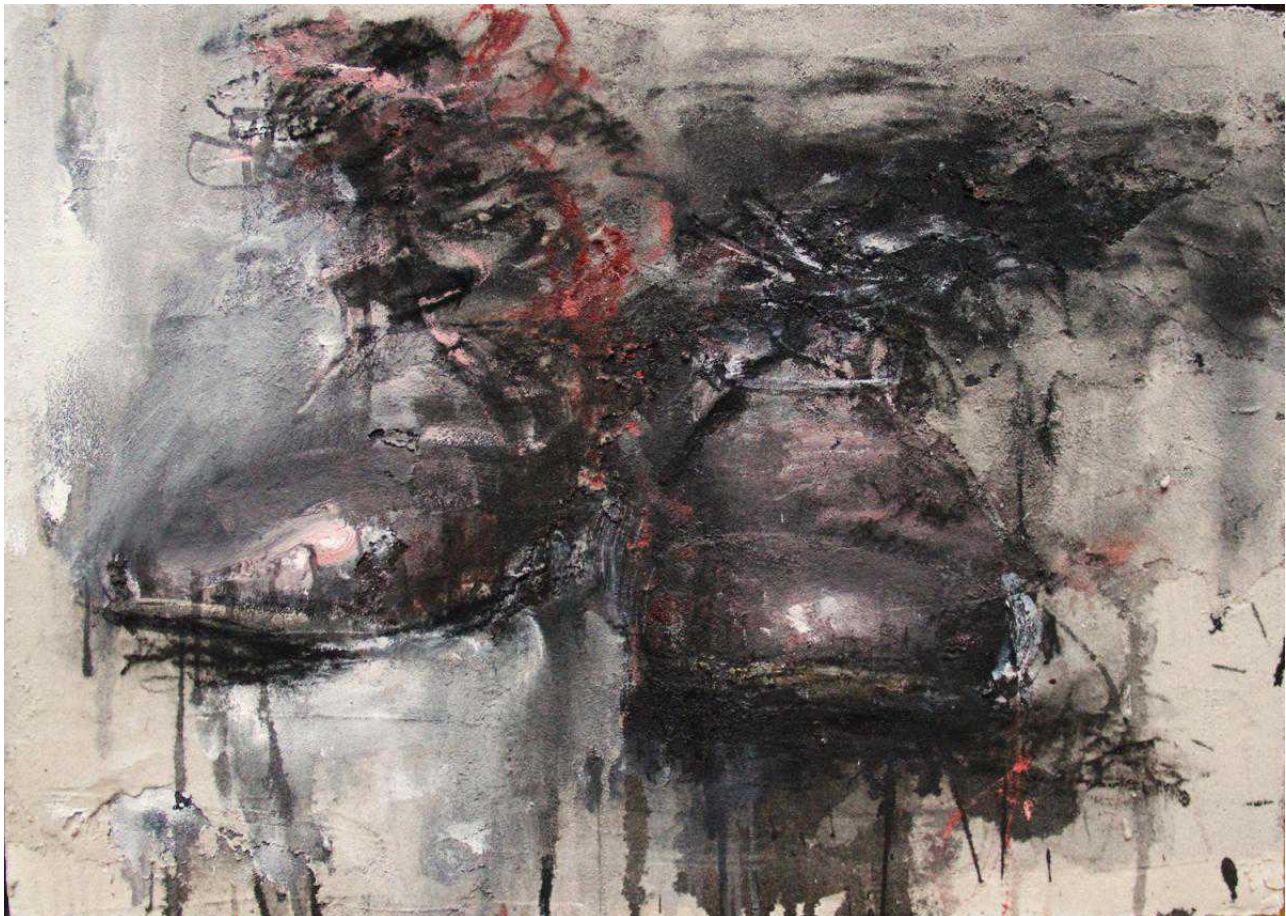
"Правый и левый"

швейцарская культура художники в Швейцарии