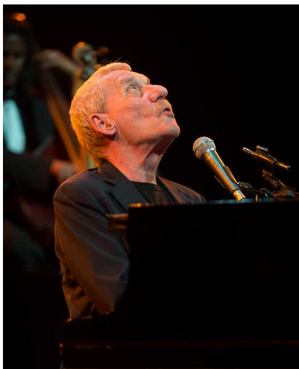
Паоло Конте