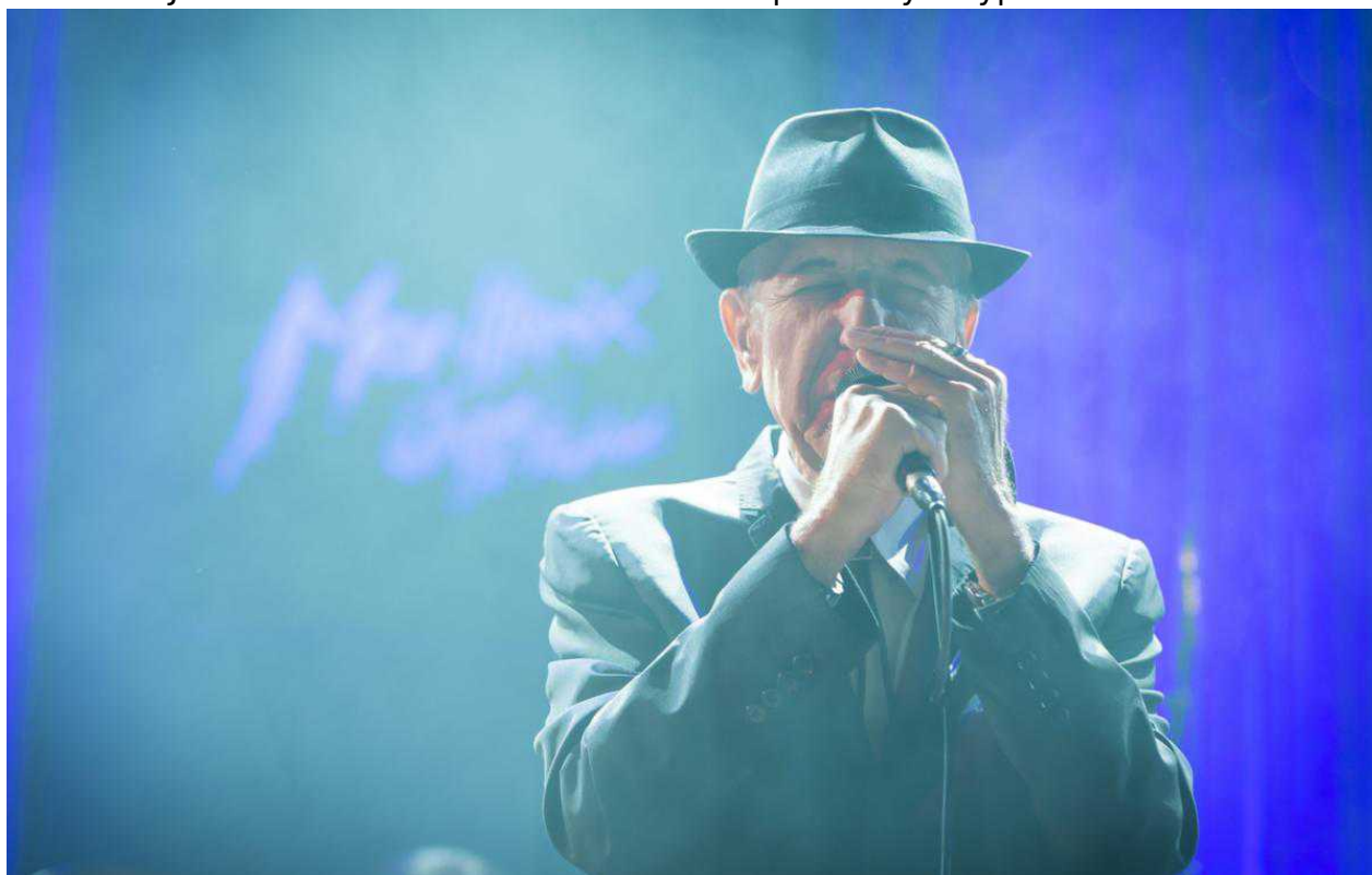
Леонард Коэн

Основная программа завершится специальным выступлением, организованным как дань памяти основателя фестиваля. Вести концерт будет композитор Куинси Джонс, близкий друг и соратник Клода Нобса, вместе с которым им удалось сделать Montreux Jazz Festival знаковым событием мировой культуры.