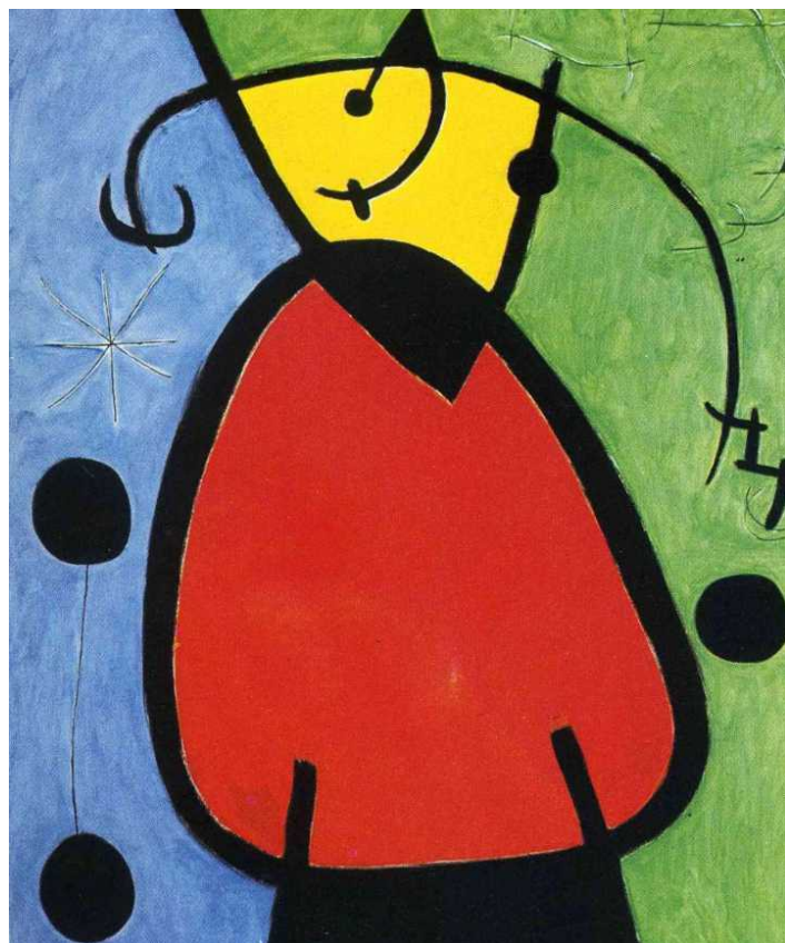
Рождение дня. Жоан Миро. 1968 год

динамично выведенными рукой мастера. И тогда каждая линия, каждое сочетание цветов наполняется значением, рассказывая зрителю историю духовных переживаний.