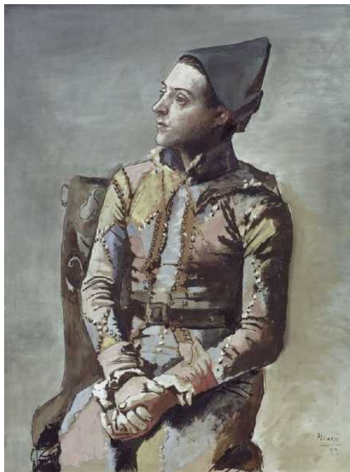
Сидящий Арлекин. Пабло Пикассо. 1923

Всего на выставке собрано около 60 картин, более сотни рисунков и набросков, созданных в разные периоды творчества. Это немыслимое богатство и великолепиие хранится в Базеле – в государственных музеях или в частных коллекциях. Как вышло, что Пикассо стал одним из самых популярных художников среди местных жителей?