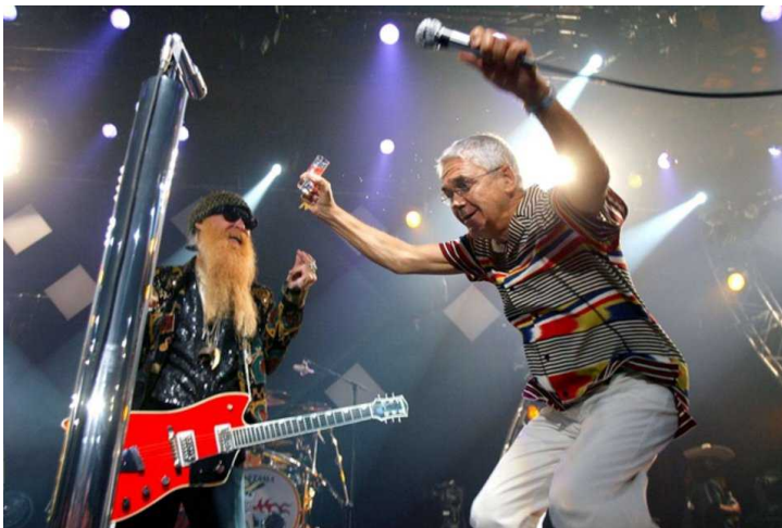
Нобс с гитаристом Билли Ф. Гиббонсом из группы ZZ Top в 2003 году

В 1963 году Клод отправился в Лондон, чтобы послушать игру начинающей музыкальной группы под названием Beatles. Пришел в восторг, подружился с Брайаном Эпштейном, Джоном, Джорджем и Ринго и пригласил их в Монтрё. Те согласились. Но швейцарское телевидение не поддержало молодого энтузиаста: «Их же никто не знает!» Beatles так никогда и не выступили в Швейцарии. А Клод Нобс в следующем году пригласил в Монтрё Rolling Stones.