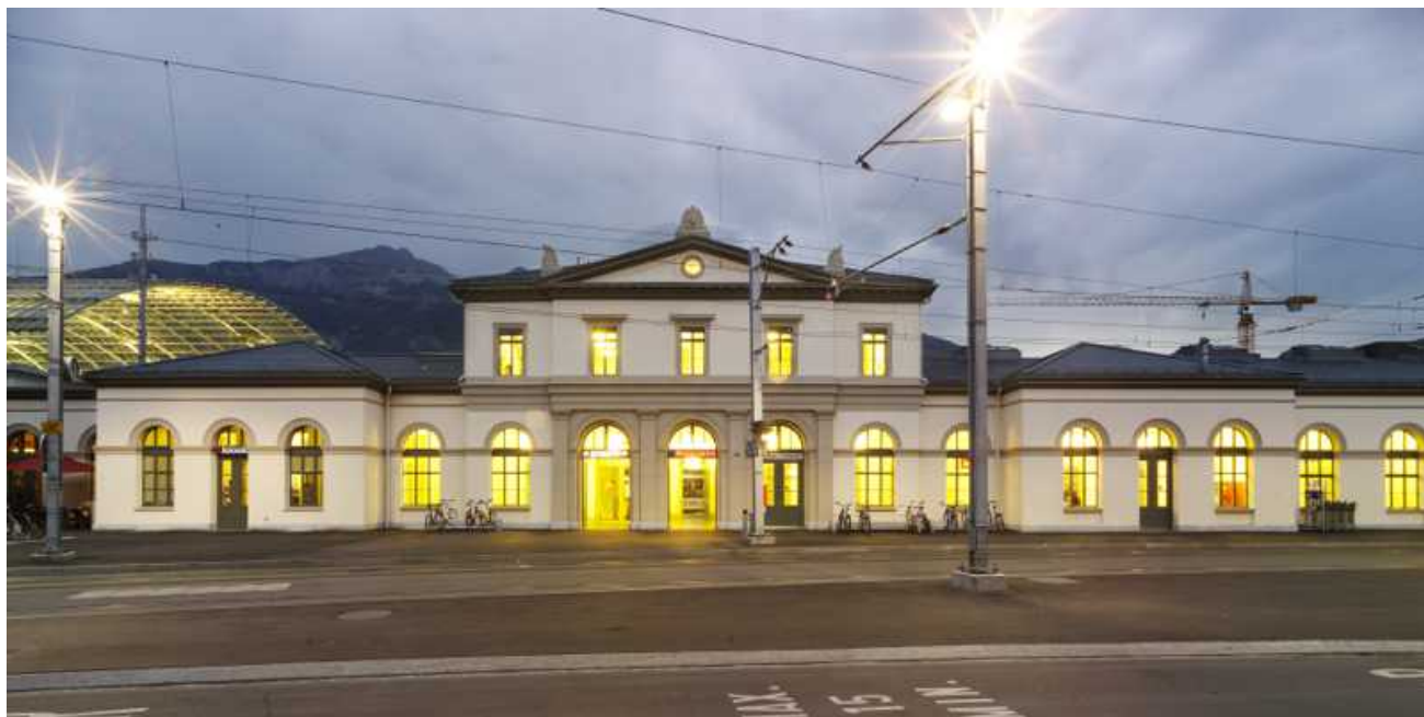
Железнодорожный вокзал Кура

старое здание, выстроенное в стиле неоренессанса, не справлялось с логистикой. Победителем архитектурного конкурса в 2000 году стал урбанистический проект, предлагавший пересмотреть инфраструктуру вокзала и прилегающей площади, максимально используя старые строения.