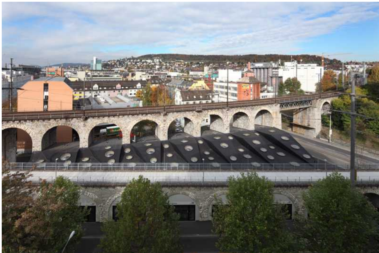
Виадук Леттена в Цюрихе