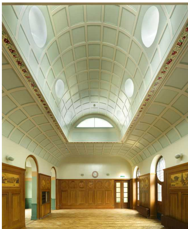
Интерьер вокзала в Куре

14 октября в Вашингтоне международная ассоциация The Watford Group, объединяющая профессионалов в сфере железнодорожного строительства и дизайна, объявила лауреатов своей премии Brunel International Awards. Престижная награда раз в четыре года присуждается лучшим образцам железнодорожной архитектуры, промышленной инфраструктуры, дизайна локомотивов и вагонов. При этом оцениваются не только эстетические качества проектов, их реализация и привлекательность в глазах пассажиров, но и экологические аспекты, как соблюдение принципов устойчивого развития при строительстве и эксплуатации.