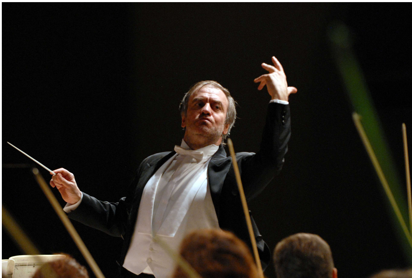
Маэстро Валерий Гергиев