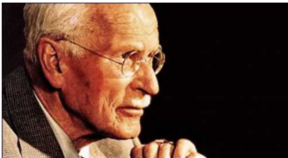
Карл Густав Юнг

Автор: Александр фон Ган, Лондон , 06.06.2011.