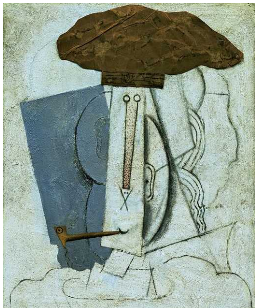
Пабло Пикассо, Студент с трубкой, 1914г.

Несмотря на враждебность некоторых критиков – всегда найдутся консерваторы, осуждающие глоток свежего воздуха! - и опрометчивый диагноз Юнга, выставка пользовалась необычайным успехом, и известный художник Оскар Шлеммер удивлялся рекордному количеству посетителей – 34 000 зрителей за девять недель. Желающих было столько, что выставку даже пришлось продлить на 14 дней! Из 225 произведений тридцать было выставлено на продажу, одно из них, «Гитару на столике» 1915 года, приобрел Кунстхаус.