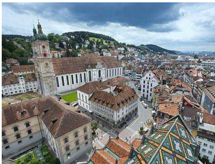
Ансамбль Санкт-Галленского монастыря

Предпоследняя остановка, которую отделяют от Санкт-Галлена три минуты, – крошечный полустанок посреди величественных склонов. Еще более сомнительным кажется существование поблизости крупного городского центра, когда идет непрерывный дождь, пеленой покрывающий размытые туманом окрестности. Тем не менее, в одно мгновение за окном вместо голубоватых холмов окажутся современные здания, и поезд действительно прибудет на большой вокзал. Седьмой по величине город Швейцарии не смыло дождем, и меньше всего он похож на край света: скорее наоборот, воображение связывает Санкт-Галлен с великим прошлым европейской культуры. А ведь когда-то здесь тоже лежали бесконечные волнистые холмы, покрытые лесами.