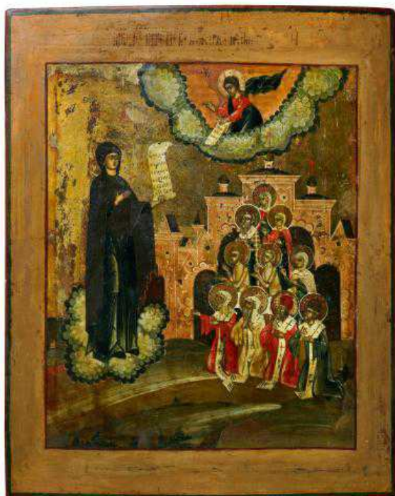
Богоматерь Боголюбская, икона 1800 г.