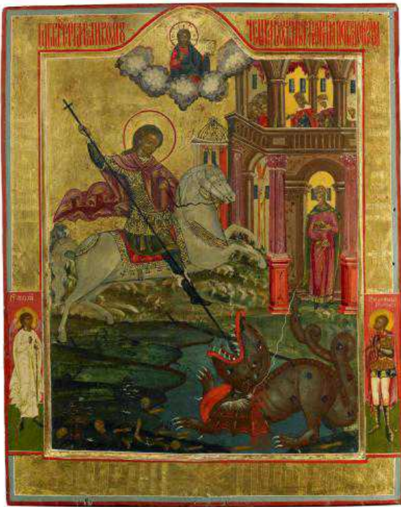
Святой Георгий, убивающий змия. Икона 18 века