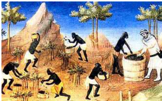
Сбор перца. Картина XV века

С XI века пряным балом правит Венеция. Ловкие венецианские торговцы сразу смекнули, что необязательно плыть за три моря, чтобы устранить всех возможных соперников и обладать эксклюзивным правом на продажу специй. Арабские корабли, приплывавшие из Индии и Китая нагруженные пряностями, бросали якорь в портах Александрии, Кипра и Константинополя. Именно туда и отправлялись венецианцы, чтобы закупить драгоценные приправы – перец, корицу, шафран, имбирь... Дипломатической хитростью Венеция добилась от Византии исключительных таможенных льгот на всей территории империи и опередила Геную, обеспечив себе монополию по торговле пряностями во всем Средиземноморье.