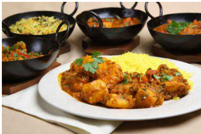
Традиционный индийский карри

Порошок высушенного корневища одноименного растения содержит ценные эфирные масла, полезные свойства которых были известны еще в Древней Индии. Так, считалось, что куркума очищает организм. Доказано, что она обладает противовоспалительным, сильным спазмолитическим, бактерицидным и антисептическим действием и является сильным антиоксидантом – поэтому издавна ее использовали для приготовления косметических масок (осторожнее, так как куркума окрашивает кожу!). Однако ее лечебные свойства этим далеко не исчерпываются. Оказывается, куркума полезна для пищеварения, помогает при расстройствах желудка, заболеваниях обмена веществ, гриппе и простуде, тонизирует организм после болезни, заживает язвы. Ученые предполагают, что куркума помогает справиться с гастритами, артритом, предотвратить атеросклероз и раковые заболевания.