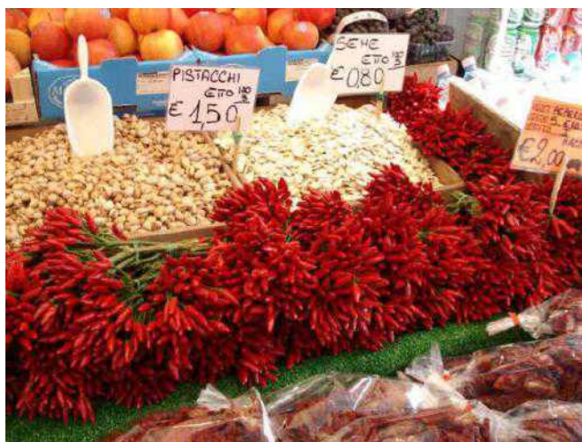
Современный рынок специй на мосту Риальто в Венеции

Но блаженствовать Светлейшей Владычице моря и Дочери Юпитера пришлось не долго. Наступила эпоха Великих географических открытий и на морскую сцену вышли другие актеры - португальцы. Их целью стал поиск не только новых земель и золота, но и новых дорог на Восток – к пряностям.