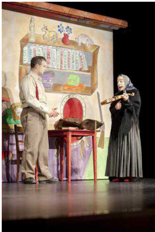
Сцена из спектакля. © Yunus Durukan

Мало кто знает, однако, что невероятным образом (а для тех, кто верит в приметы и знаки свыше, вполне вероятным) связь между Стравинским и Швейцарией существовала буквально со дня его рождения. Дело в том, что Игорь Федорович родился в 1882 году в 40 км от Санкт-Петербурга в Ораниенбауме (тогдашний дачный поселок вырос теперь в город Ломоносов) на улице под названием Швейцарская. Почему в этом городке была такая улица, выяснить не удалось, но именно там снимал дачу его отец, певец-бас, солист Мариинского театра Фёдор Стравинский.