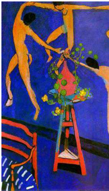
Анри Матисс. Танец вокруг настурций, 1912г.

«Гора Святой Виктории» (1878) Поля Сезанна не только свидетельствует о любви художника к пейзажам Прованса, но и становится первой ласточкой авангардного искусства. От теории Сезанна о простых формах и цветах прямой путь ведет к первым кубистическим экспериментам Дюшана, Брака и Пикассо.