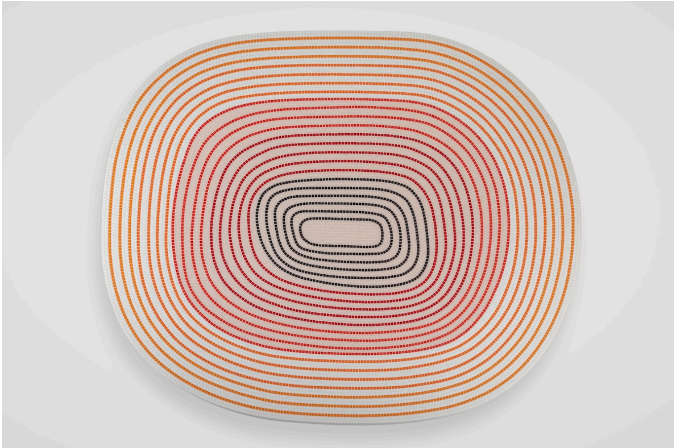
«All Aperto Table» Пьера Шарпена

Еще один заметный объект – стол «All Aperto Table» Пьера Шарпена (Galerie Kreo). Рисунок, нарисованный Шарпеном вручную, расходится по столешнице, как волна, а цвет распадается на градиент. Мелкие мозаичные плитки были вырезаны и уложены вручную в соответствии с рисунком.