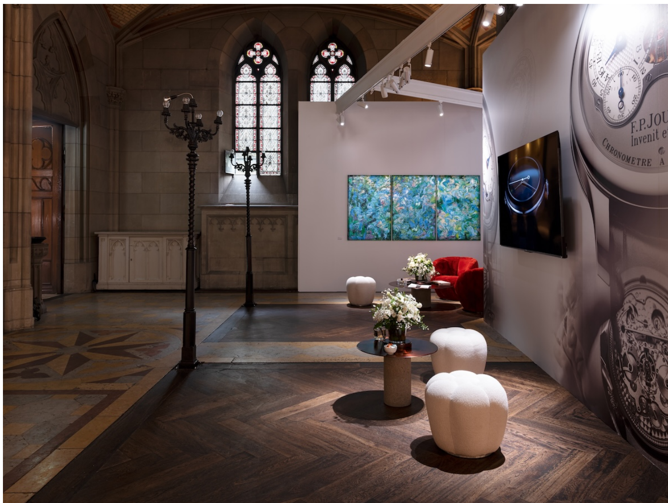
Стенд F.P. Journe на MAZE Design Basel. Фото: F.P. Journe

Auteur: Заррина Салимова, Базель , 26.06.2025.