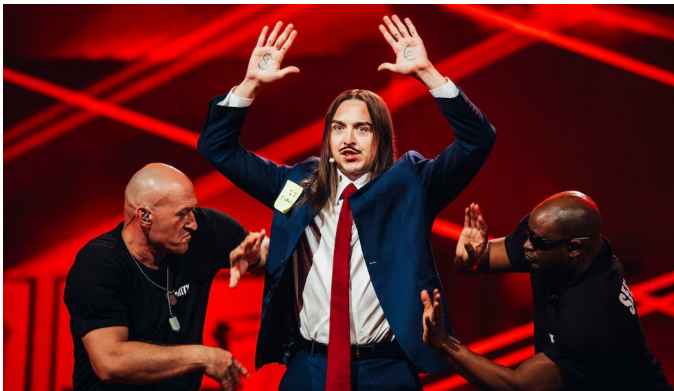
Томми Кэш - третье место

регламенте появилось новое требование к артистам: их выступления не должны содержать ничего, что могло бы вызвать полемику. (Требование, на наш взгляд, несправедливое и с трудом выполнимое, ведь в разгоряченных головах полемику может вызвать абсолютно все.) Правила ужесточились не только из-за очевидной растущей политизации и коммерциализации конкурса, но и чтобы не отпугнуть спонсоров. В 2009 Грузия была дисквалифицирована за песню, содержащую неуважительное упоминание российского президента, в 2015-м не была допущена к конкурсу Армения – в представленной ею песне упоминался геноцид армян, а в 2022-м году этот список пополнила Россия, понятно почему.