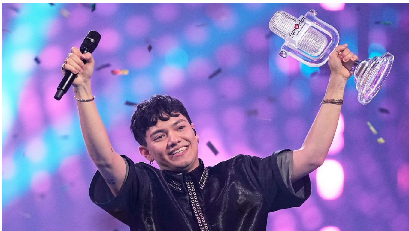
«JJ», он же Йоханнес Пиеч, - победитель конкурса Евровидение 2025

Евровидение привлекло на различные площадки музыкального фестиваля в Базеле около 500 000 человек. Об этом в субботу сообщила Европейская вещательная ассоциация на основании информации от городских служб. Только на крупнейшем публичном показе в Arena Plus в парке Св. Иакова насчитали 36 тысяч человек. Если добавить к этому девять представлений в зале Св. Иакова, то организаторы оценивают число посетивших мероприятие в более чем 100 000 человек. Баланс, подведенный организацией Basel Tourismus, также очень положительный – отели были заполнены почти на 95%. «Все идет по плану, и все участники хорошо поработали», — отметила ее директор Летиция Элия. По ее словам, тот факт, что отели были заполнены не полностью, связан, в частности, с тем, что многие поклонники Евровидения обычно останавливаются у местных жителей, а организованное на время конкурса ночное транспортное сообщение позволяет фанатам вернуться домой или даже остановиться в соседней Германии, в Эльзасе или в другом швейцарском городе. Сколько человек смотрели заключительный спектакль в прямой трансляции, пока неизвестно, но в субботу весь центр Базеля превратился в гигантскую праздничную площадку с меломанами и местными жителями, одетыми в яркие цвета.