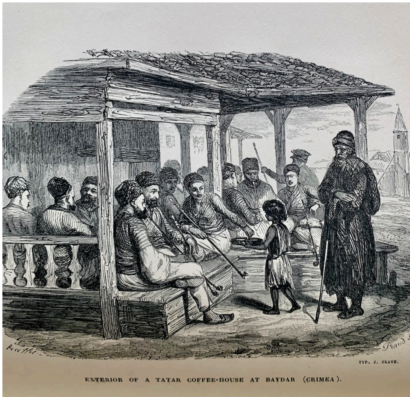
EXTERIOR OF A TATAR COFFEE-HOUSE AT BAYDAR (CRIMEA).

Огюст Раффе. Татарская кофейня в Байдаре, ок. 1837-1940 гг.