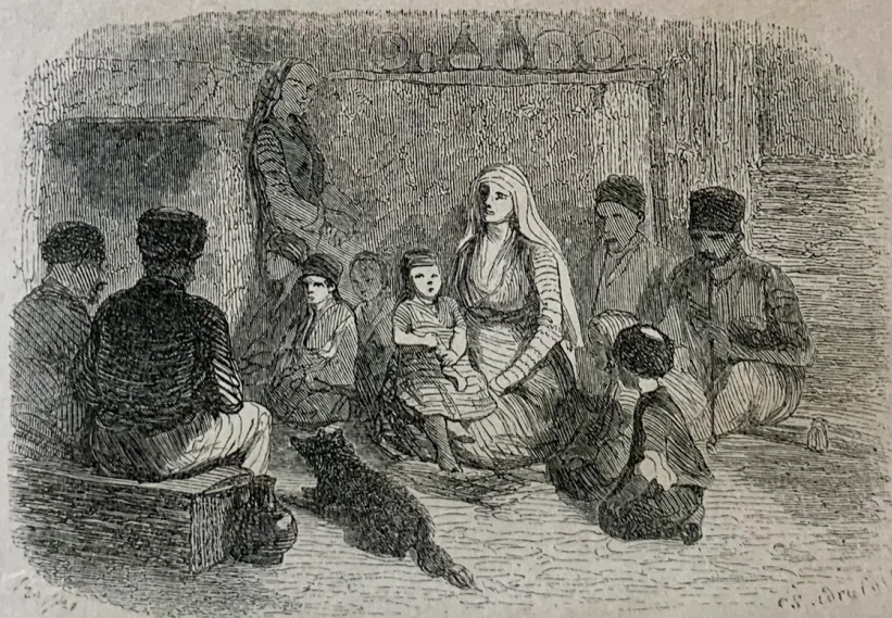
Intérieur d'une famille tatare.

Dédié à S. M. Nicolas 1 er , Empereur de toutes les Russies.