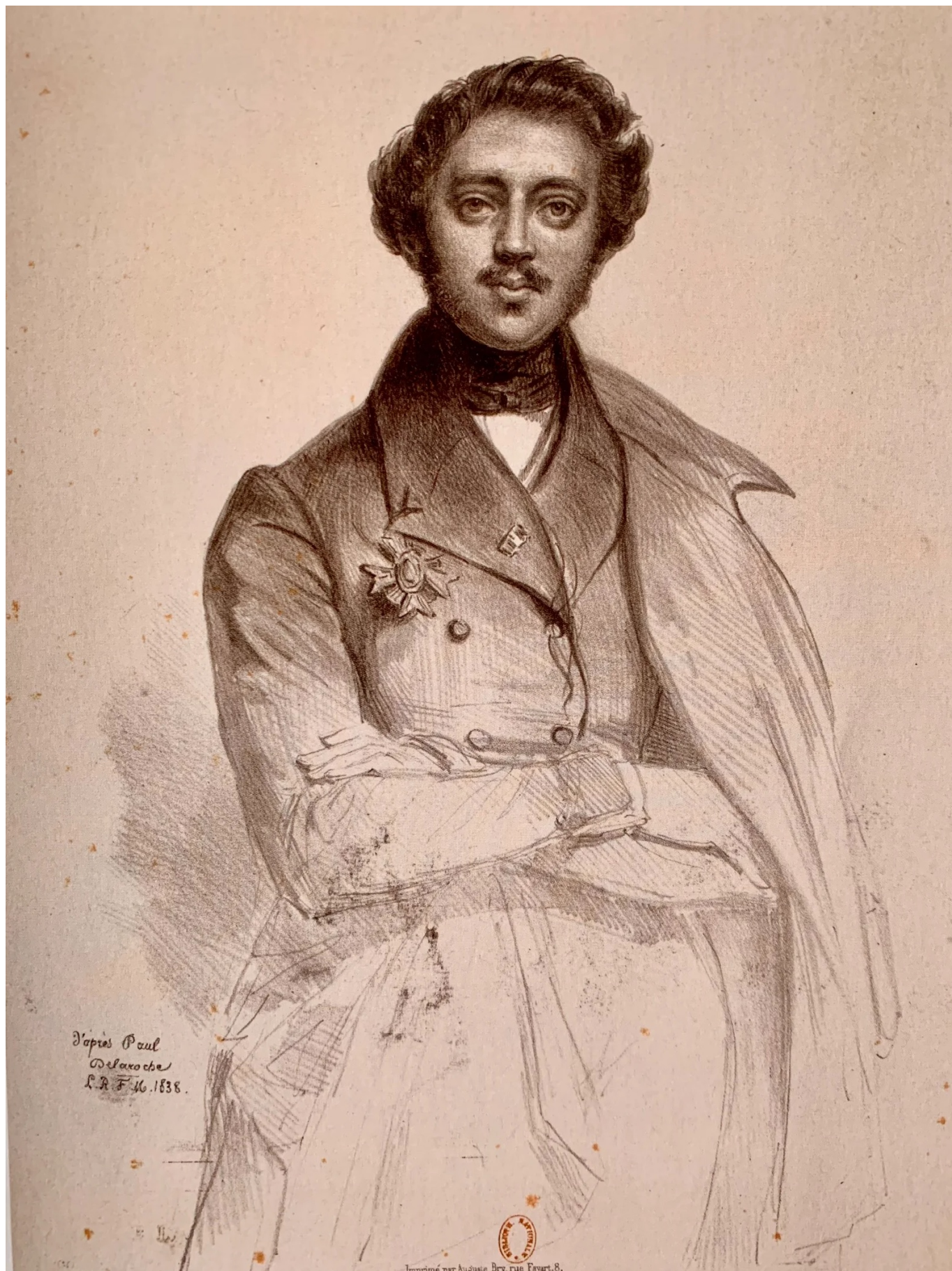
Поль Деларош. Портрет Анатолия Демидова. 1838 г.