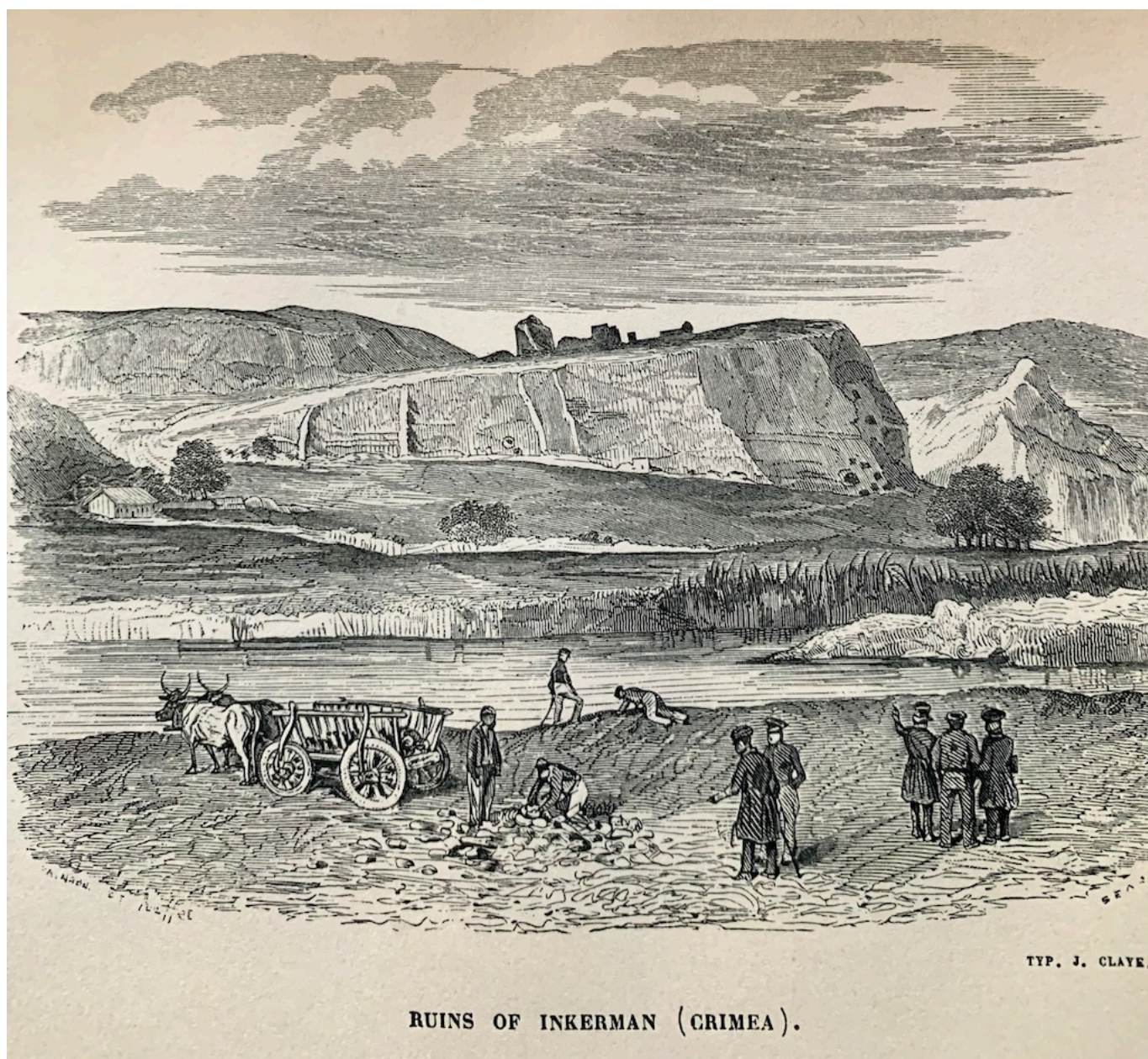
Огюст Раффе. Инкерманские кони в Крыму, ок. 1837-1840 гг.