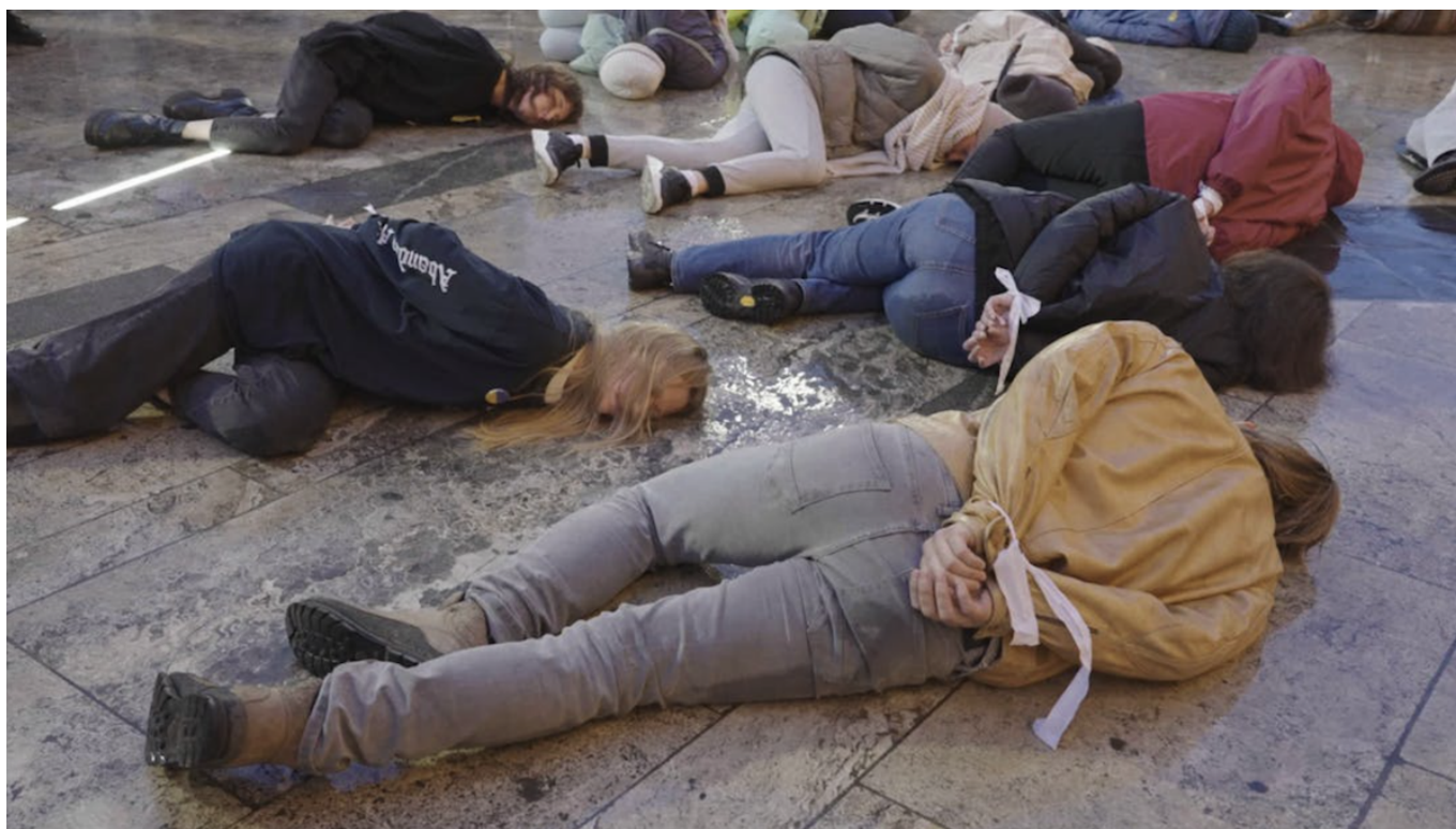
Кадр из фильма «Дом».

За главный приз Золотурнского фестиваля – и самую престижную кинопремию Швейцарии – поборются два художественных и четыре документальных фильма, включая «Дом» Светланы Родиной и Лорана Стоопа. Картина посвящена потерянному поколению молодых россиян. В приюте для беженцев в Тбилиси оказываются активистка движения за права женщин, молодая пара журналистов, сторонник Алексея Навального, политический блогер. Все они были вынуждены покинуть родину из-за войны и репрессий: в Грузии они живут как цифровые диссиденты и отсюда отправляются на поиски нового дома. Ленту можно будет посмотреть 25 и 28 января.